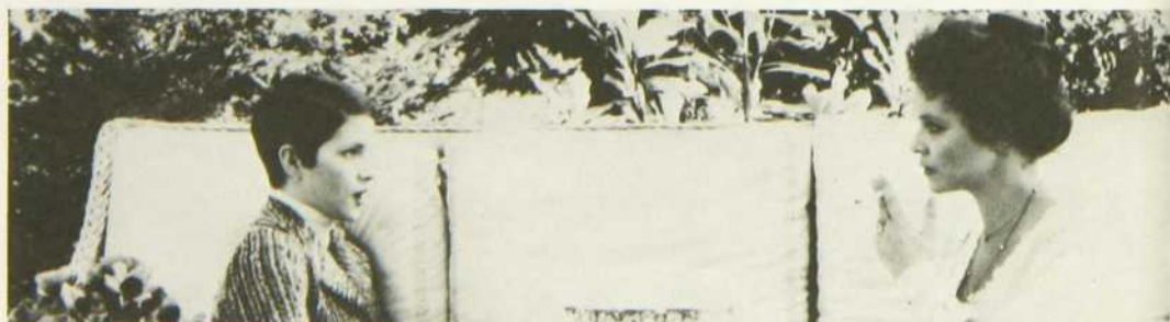
«La Maitresse légitime»