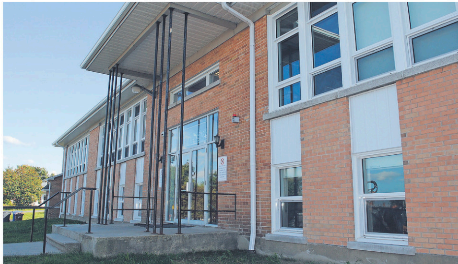
Après deux mois d'inactivité, les écoles primaires retrouveront leurs élèves à compter du 11 mai prochain.

Autant pour les enfants que pour le personnel enseignant, une période d'adaptation est à