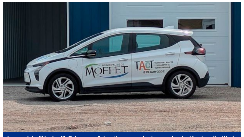
La municipalité de Moffet, en collaboration avec le transport adapté et collectif du Témiscamingue, lançait le 15 juillet dernier un projet d'autopartage. Cette démarche vise à faire la location d'une voiture électrique pour les citoyens de la municipalité de Moffet, et ce, à bas prix.

Après plus de 15 ans de service dévoué, la Coop Santé Témiscavie a cessé ses activités le 16 juin. La décision, rendue nécessaire par le départ prochain à la retraite de trois de ses quatre médecins, marque la fin d'une ère pour cet établissement qui, depuis sa création en 2008, s'est imposé comme un pilier de la santé et du bien-être pour la communauté témiscamiennne.