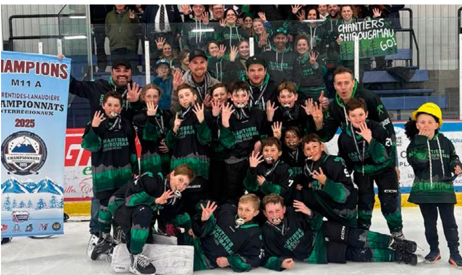
L'équipe de hockey M11A Chantiers Chibougamau était du côté de Terrebonne pour les Championnats interrégionaux Laurentides-Lanaudière du 11 au 13 avril. C'est grâce à une victoire de 3 à 1 contre Lachenaie que l'équipe a remporté la bannière de champions. Le M15A Lactalis Laverlochère était de son côté en action pour les affrontements qui se déroulaient au Mont-Tremblant. L'équipe s'était qualifiée en remportant la finale régionale en tirs de barrage. Le Lactalis s'est malheureusement incliné en finale.

Le comité événementiel de Guigues organisait la première édition du All-Star du Témiscamingue le 9 mars. L'événement se voulait un concours d'habileté pour les jeunes hockeyeurs et hockeyeuses de 9 à 15 ans.