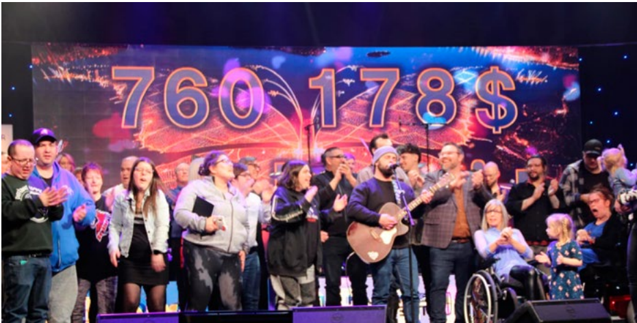
Le 28 e Téléthon de La Ressource pour personnes handicapées de l'Abitibi-Témiscamingue et du Nord-du-Québec, sous le thème Illuminons l'avenir , a permis de récolter une somme de 760 718 $, bien au-delà de l'objectif initial de 500 000 $. Ce généreux montant permettra de financer des services essentiels tels que le répit-dépannage, le transport spécialisé, l'adaptation de domicile, l'intégration sociale, des loisirs adaptés et autres pour les membres de l'organisme.

Les centres de services scolaires (CSS) de l'Abitibi-Témiscamingue s'engagent activement pour la sécurité des élèves et se joignent à la campagne Fais pas l'autruche visant à sensibiliser tout au long de l'année scolaire les élèves, les parents et les conducteurs à l'importance de la prudence aux abords des écoles et en transport scolaire.