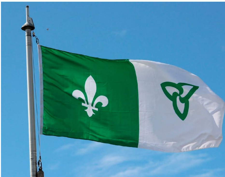
Pour souligner le 50 e anniversaire du drapeau franco-ontarien, la Police provinciale de l'Ontario (PPO) a fait personnaliser une voiture de patrouille aux couleurs vertes et blanches, symboles forts de la communauté franco-ontarienne.