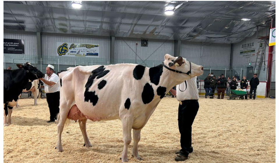
Malgré une météo capricieuse, la 52 e Exposition agricole de St-Bruno-de-Guigues, qui s'est tenue du 31 mai au 1 er juin, a connu un franc succès, notamment grâce à l'implication grandissante de la relève au sein de son comité organisateur.

Le regroupement Mémoires des chemins d'eau a lancé le 21 mai dernier sa saison touristique à la Centrale Première-Chute, marquant ainsi le coup d'envoi des activités estivales dans les musées du Témiscamingue. Grâce à un partenariat avec la MRC de Témiscamingue, les résidents de la région profitent à nouveau d'un rabais de 50 % sur les droits d'entrée dans les musées membres du réseau, et de 25 % au parc national d'Opémican.