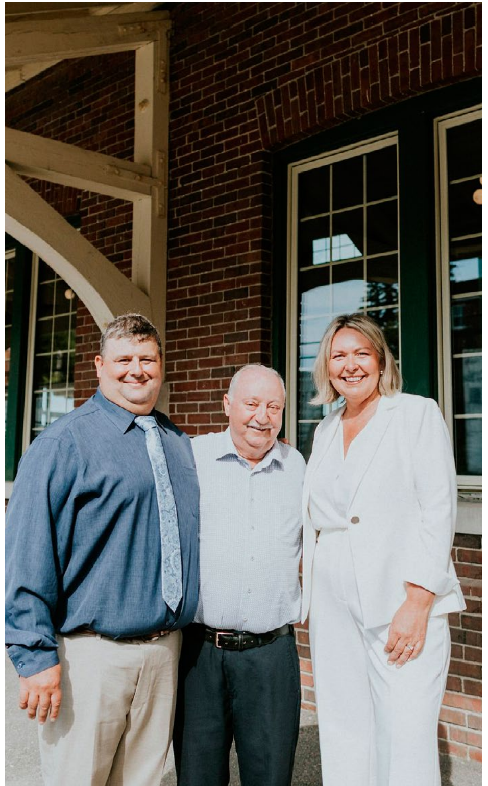
Le 25 juin dernier a eu lieu la grande réouverture de la gare ferroviaire de Cobalt. Après un an et demi de travaux, la bâtisse historique souhaite maintenant accueillir toutes sortes d'événements : mariages, réunions professionnelles, fêtes familiales, spectacles, etc. Deux suites luxueuses y ont également été aménagées afin de proposer une option d'hébergement aux visiteurs.