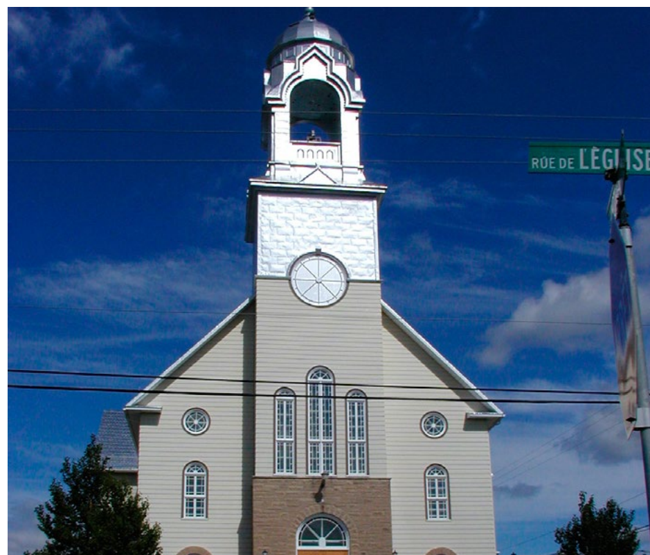
Les églises témiscamiennes se trouvent à la croisée des chemins. Un comité, Écho du Clocher, s'efforce de maintenir les activités de l'église de Lorrainville. La collecte de fonds annuelle est de retour, ayant pour objectif d'amasser 50 000 $ afin d'assurer la survie des lieux.

Les rencontres prénatales de groupe, qui étaient offertes en mode virtuel uniquement, ont pris fin le 3 avril. En ce qui concerne les nouvelles inscriptions pour ces rencontres présentées par les intervenants du Centre intégré de santé et de services sociaux de l'Abitibi-Témiscamingue (CISSAT), elles ont été suspendues jusqu'à nouvel ordre. Le CISSAT souhaite évaluer le service afin d'offrir des rencontres prénatales de groupe qui répondront peut-être davantage aux besoins des futurs parents.