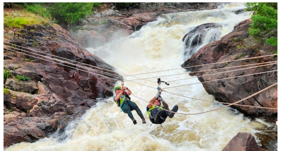
La quatrième édition du Raid international Témiscamingue a été lancée, le 4 septembre. Dès le lendemain, la fébrilité s'est transportée à Témiscaming où se tenait le Raid Jeunesse Desjardins qui a attiré plus d'une centaine d'adolescents. Le premier Raid senior a quant à lui réuni treize participants de 60 ans et plus, répartis en six équipes.