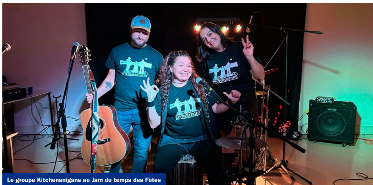
Le groupe Kitchenigans au Jam du temps des Fêtes