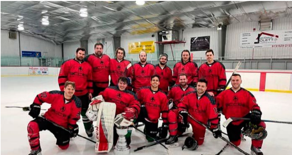
Le Tournoi intermédiaire de Guigues, organisé chaque année par le Comité récréatif de Guigues au Colisée de Guigues, se déroulait du 24 au 26 janvier dernier. Cette 47 e édition a attiré 19 équipes des catégories C et D, regroupant un total de 285 joueurs. Les rencontres se sont tenues non seulement au Colisée de Guigues, mais également à l'aréna Frère-Arthur-Bergeron et à l'aréna de Notre-Dame-du-Nord.

La 9 e édition du tournoi de hockey féminin a eu lieu du 17 au 19 janvier au Colisée de St-Bruno-de-Guigues. Seize équipes étaient en compétition, dont sept dans la classe B et neuf dans la classe C, ce qui égalise l'année record pour l'organisation. Le tournoi, toujours aussi populaire, a attiré les partisans des équipes et les amateurs de hockey féminin toute la fin de semaine.