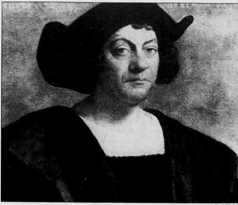
Portrait de Christophe Colomb, du peintre Sebastiano Del Piombo.

Pourtant l'ombre géante du Grand Navigateur dérange. The Knights of Columbus eux-mêmes, braves mais pas téméraires, éludent le sujet.