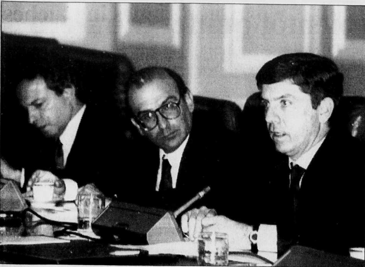
Le président Cesar Gaviria, à droite, à l'issue de la réunion du conseil de sécurité colombien, dimanche.