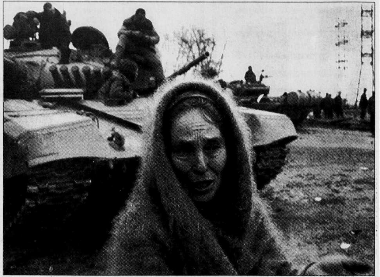
Une réfugiée ingouche a raconté hier les combats qui se sont déroulés entre rebelles ossètes et soldats russes.

L'état des lieux va dans le sens des témoignages des réfugiés ingouches selon lesquels les troupes