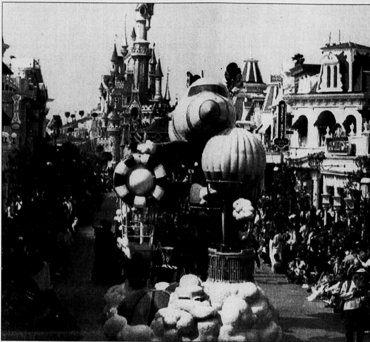
L'Euro Disney ne respecte peut-être pas les lois pour ce qui est de l'accueil, de la signalisation et de la langue d'usage de ses castings members, mais ce parc d'attraction géant a attiré quelque 6 millions de visiteurs. Sylvester Stallone et Madonna obtiennent un succès fou en France, beaucoup plus important que celui de plusieurs vedettes locales.

On la croyait française par atavisme, la France, et pour l'éternité. Mais ce n'est plus vrai. C'est là que réside le problème. On découvre une réalité qui laisse songeur, dès qu'on gratte un peu le vernis: celle d'un pays qui choisit parfois délibérément de se ranger du côté du plus fort, cédant au démon de la facilité. Si bien qu'aujourd'hui, l'Hexagone n'est certainement plus aussi fran-