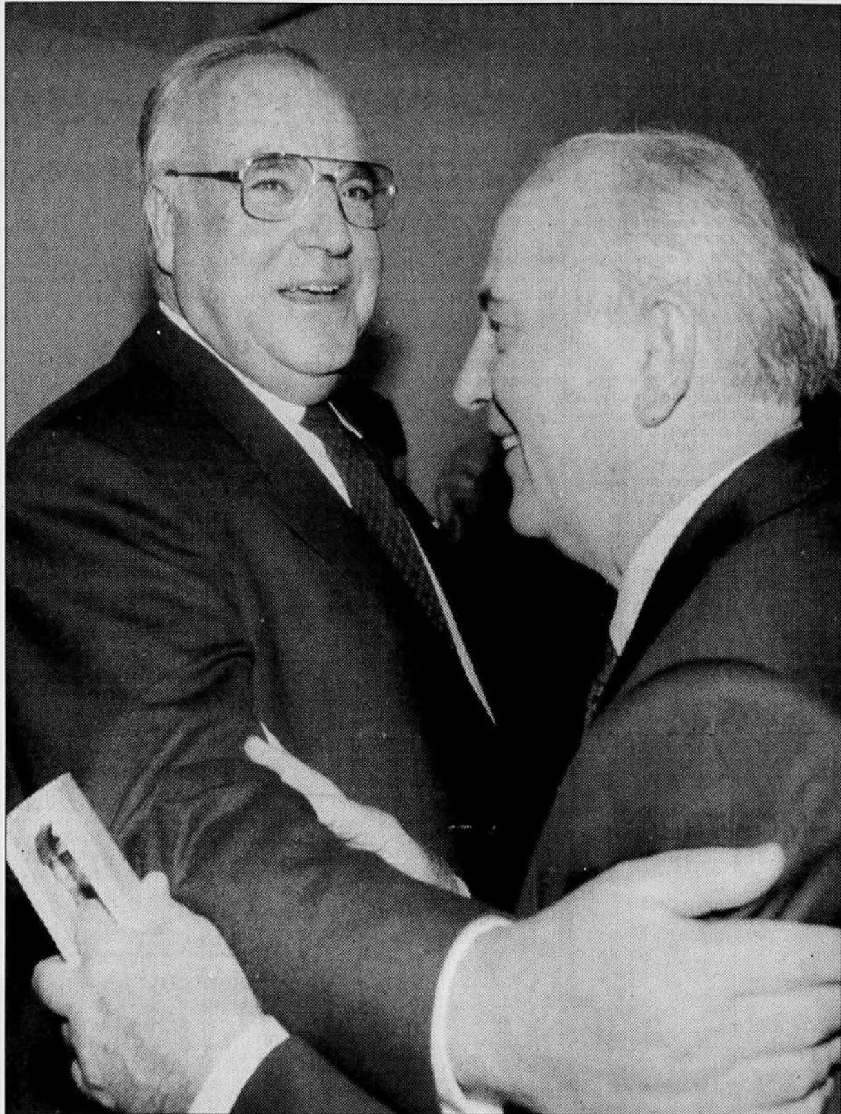
Mikhaïl Gorbatchev étreint le chancelier allemand Helmut Kohl lors d'une cérémonie hier à Berlin.

Si son plan est rejeté, M. Karadzic a indiqué que les forces serbes «attendront la mise au point d'un nouveau plan convenant aux trois parties et dans l'intervalle défendront leur pays».