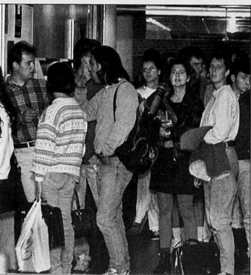
Le mémoire du comité de coordination provinciale de philosophie, fondé sur l'idéologie du néo-libéralisme économique, a été adopté avant même que les départements n'aient été apparemment consultés.

Et dans cette formation fondamentale de base, l'apprentissage de la philosophie comme fonction critique devient alors essentiel et prend véritablement la tout son sens. Dans le mémoire syndical présenté à la commission parlementaire par mon collège, il est