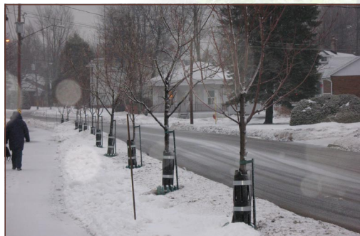
Les photos nous montrent des protections hivernales pour les arbres installées à proximité des voies de circulation.

sur l'écorce, les bourgeons et entre les cellules sans que la plante ne soit trop endommagée.