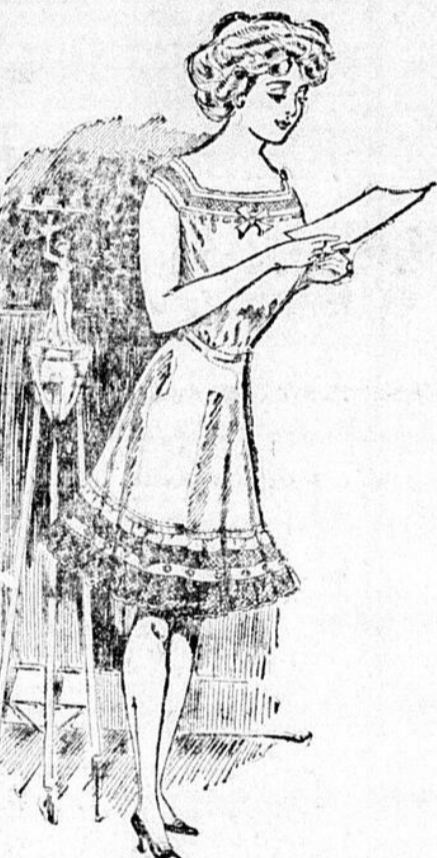
Pantalons, Comme la Vignette Jupons de batiste blanche de qualité supérieure, très bien garnis d'insertion de dentelle Cluny et bordure incrustée d'insertion de broderie, points 23, 25 et 27, prix de cette vente . . . . . 63c

Chemises de nuit en batiste blanche, emplacement d'insertion de dentelle, garnies de dentelle, prix régulier 60 cts ; prix de cette vente . . . . . 37 cts Chemises de nuit en batiste blanche, emplacement carré de dentelle torchon et remplis à jours, prix régulier $1.10 ; prix de cette vente . . . . . 79 cts Chemises de nuit en batiste blanche, emplacement d'insertion de broderie, également à bordure, prix régulier $1.10 ; prix de cette vente . . . . . 79 cts Chemises de nuit en batiste blanche, emplacement rond de broderie "allover" et insertions de dentelle, prix régulier $1.50 ; prix de cette vente . . . . . $1.12 Chemises de nuit en batiste blanche, devant à panneaux de broderie et insertion de dentelle, prix régulier $1.50 ; prix de cette vente . . . . . $1.23