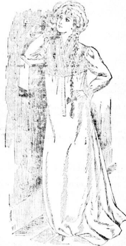
Chemises de Nuit, Comme la Vignette Chemises de nuit, en batiste, très jolies, emplacement à rangées de broderie et insertion de dentelle Valenciennes, col taillé en V, bordure de broderie au col et aux poignets, se fermant par devant, 53, 58, 60 pouces de long, prix de cette vente . . . . . $1.39