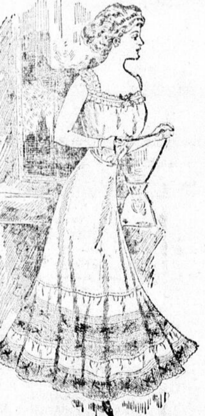
Jupons, Comme la Vignette Jupons de batiste blanche de qualité très fine, volant de linon garni de grappes de petits remplis, deux insertions et une bordure de dentelle Cluny, sous-volant taillé généralement, prix de cette vente . . . . . $1.27