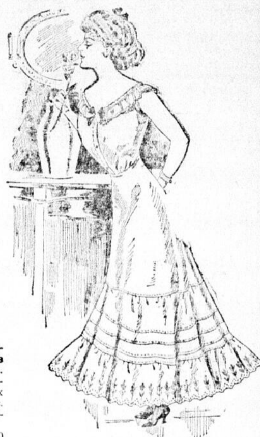
Jupons, Comme la Vignette Jupons de qualité spéciale, à volant de linon, à remplis, piqués à jours et bordés de broderie large, sous-volant taillé généralement, mens, prix de cette vente . . . . . 83c