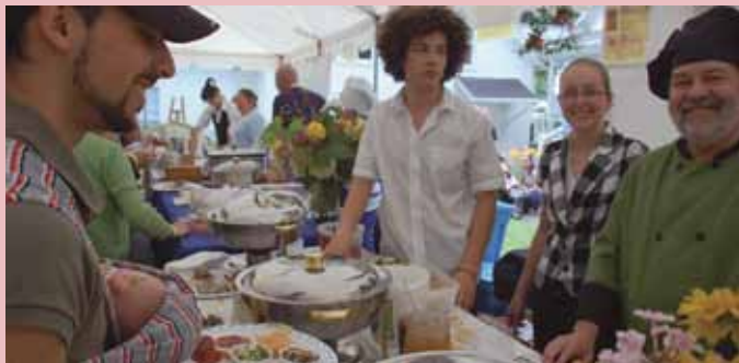
Notre plus jeune amateur de gastronomie au Week-end des Saveurs