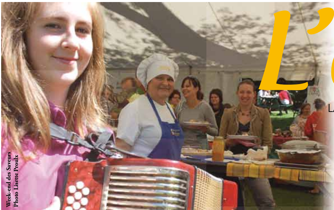
Week-end des Saveurs