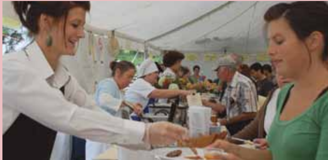
Un succès sur toute la ligne!

Encore un fois cette année, Le Week-end des Saveurs a attiré une foule nombreuse et curieuse, qui s'est empressée de savourer une variété étonnante de dégustations.