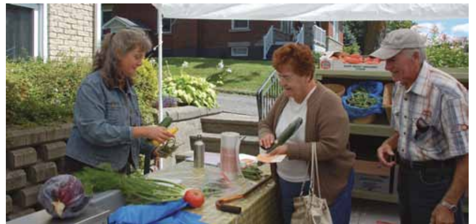
Des produits de qualité, un public heureux!