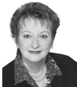
France Bonsant Députée Compton-Stanstead

C'est un honneur et un privilège pour moi de représenter mes concitoyens et concitoyennes de Compton à la chambre des Communes. Merci de votre confiance.