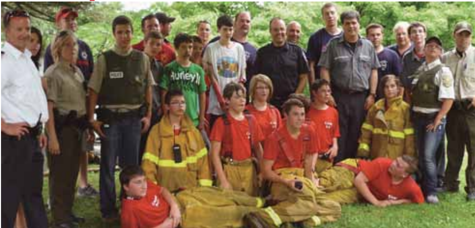
Le Camp 911 qui c'est déroulé du 12 au 16 juillet fut un très grand succès!