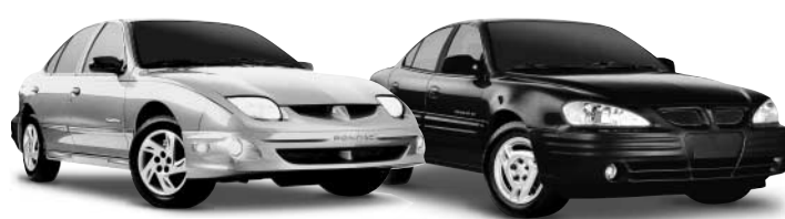
Sunfire SLX Pontiac 4 portes / Grand Am SE Pontiac