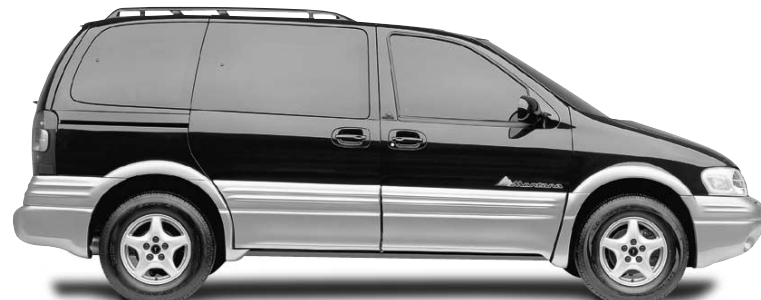
Montana Pontiac Sécurité 5 étoiles+ Fourgonnette offrant la meilleure économie d'essence de sa catégorie+*