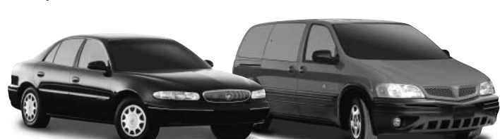
Century Buick / Montana Pontiac