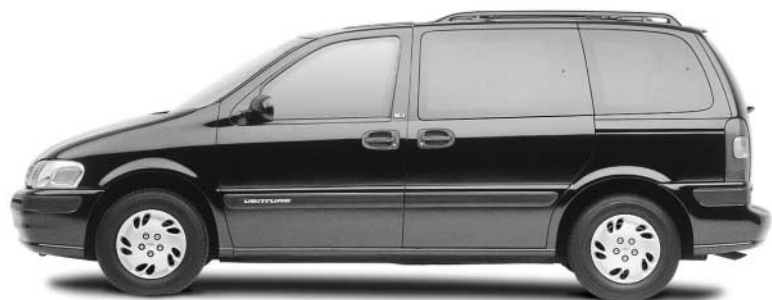
Venture Chevrolet Sécurité 5 étoiles+ Fourgonnette offrant la meilleure économie d'essence de sa catégorie+*