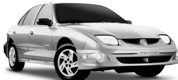
Sunfire SLX 4 portes Pontiac Garantie de 5 ans ou 100 000 km sur le groupe motopropulseur sur tous les modèles Sunfire 2001