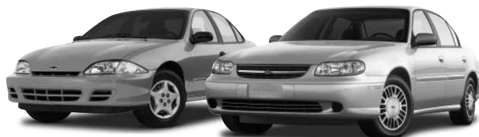
Cavalier VLX Chevrolet 4 portes / Malibu Chevrolet