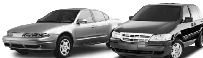
Alero Oldsmobile / Venture Chevrolet