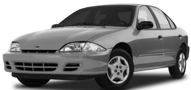
Cavalier VLX 4 portes Chevrolet Garantie de 5 ans ou 100 000 km sur le groupe motopropulseur sur tous les modèles Cavalier 2001