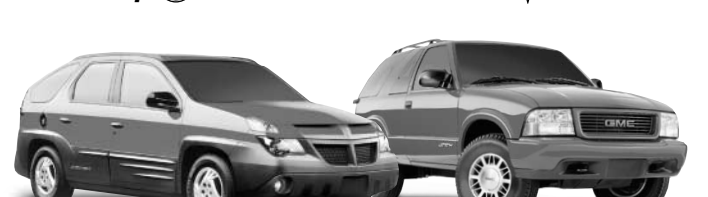
Aztek Pontiac / Jimmy GMC 4 x 4