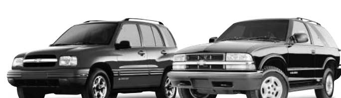
Tracker Chevrolet 4 portes 4 x 4 / Blazer Chevrolet 4 x 4