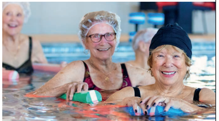
De vrais moments, de vrais résidents Soleil