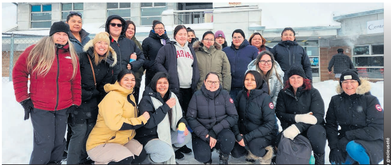
La première cohorte du Centre d'études collégiales du Cégep de Lanaudière à Saint-Zénon, formée de 17 étudiantes atikamekw.

Ce projet d'envergure est le fruit d'une précieuse collaboration. Divers acteurs du milieu ont été impliqués et le Cégep