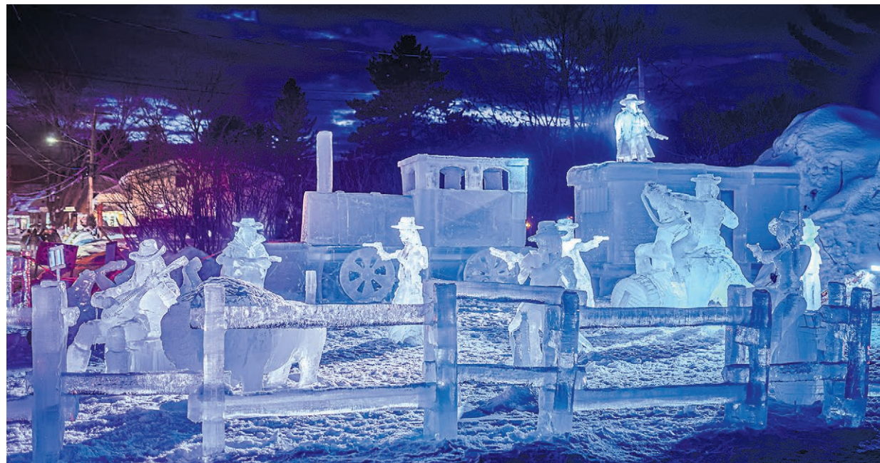
Le Festival vient de dévoiler sa programmation familiale.

Tout au long de l'événement: camions de rue, bar et boutique au Parc de l'Harmonie. Toutes les activités se déroulent à l'extérieur et sont gratuites.