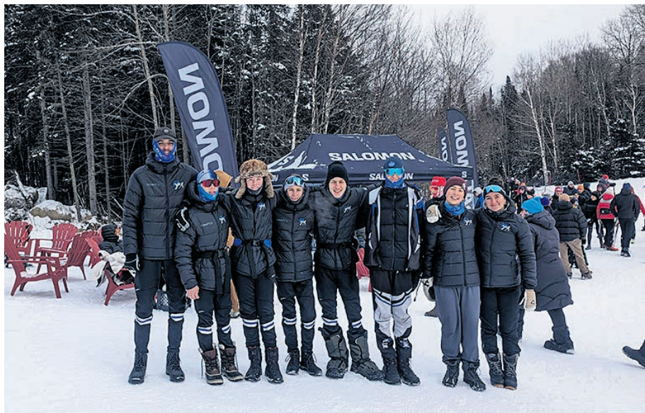
Le groupe d'athlètes au Mont Ste-Anne.