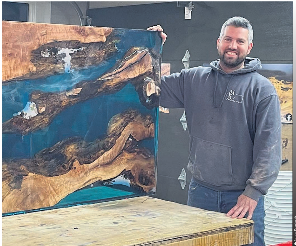
L'entrepreneur vend beaucoup de tranches de bois, mais il confectionne aussi des meubles comme des tables de cuisine.

Puisque ce projet le passionne énormément, il assure ne pas craindre de parcourir toute la région pour ces collaborations, l'aspect local étant très important pour lui afin de réduire le transport. L'entrepreneur a déjà envoyé plusieurs perches en direction de municipalités qui ont refusé de par-