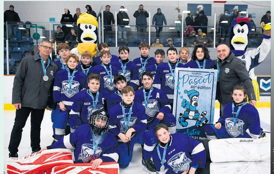
Les joueurs de l'équipe peuvent être fiers de leur performance.

Pour tout connaître des activités de L'Attaque de Thérèse-Martin, suivez sa page sur Facebook ou visitez le site web www.attaquetm.ca . (MB)