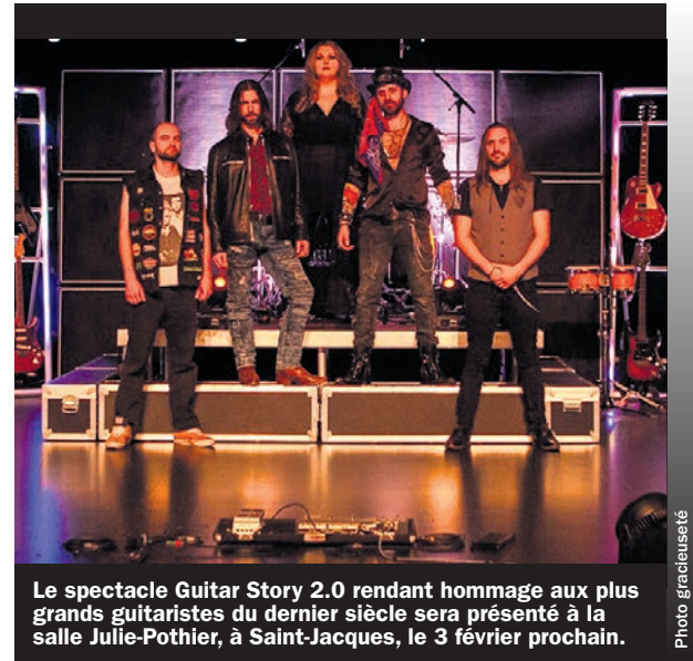
Le spectacle Guitar Story 2.0 rendant hommage aux plus grands guitaristes du dernier siècle sera présenté à la salle Julie-Pothier, à Saint-Jacques, le 3 février prochain.

La Ville de Notre-Dame-des-Prairies souscrit à un programme d'accès à l'égalité en emploi au sens de la Loi sur l'accès à l'égalité en emploi dans les organismes publics pour les femmes, les membres de minorités visibles et de minorités ethniques, les autochtones et les personnes handicapées.