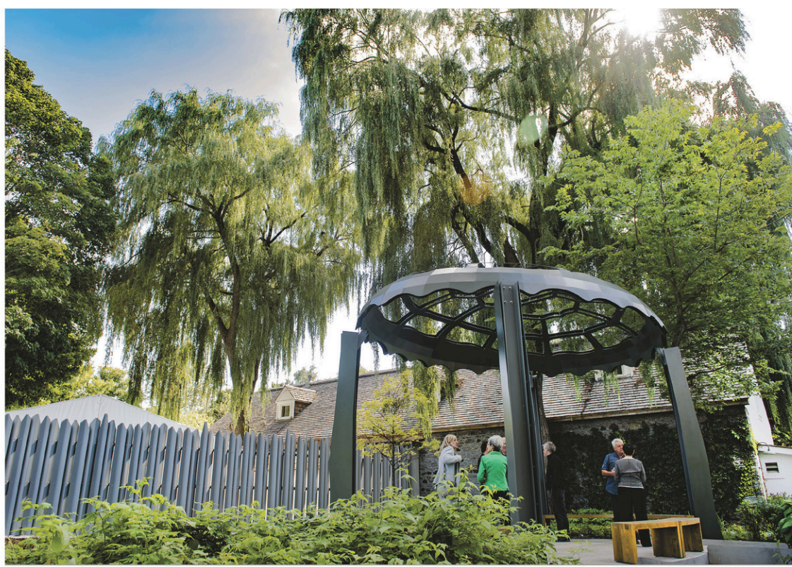
Le nouveau Jardin des origines est un espace vert aménagé au cœur de la Maison Saint-Gabriel pour rendre hommage aux femmes des Premières Nations.

Autre installation liée aux célébrations du 375 e anniversaire