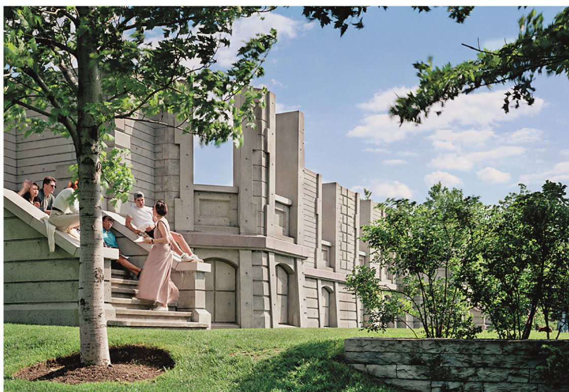
Vue du jardin du Centre canadien d'architecture

Dans l'histoire du CCA, on constate que plusieurs expositions ont abordé la question de la technologie, comme La vitesse et ses limites , en 2009. Elle célébrait le centième anniversaire du futurisme italien, mouvement dont le manifeste inaugural déclarait: «La splendeur du monde s'est enrichie d'une beauté nouvelle: la beauté de la vitesse.» L'exposition traitait de circulation, de construction rapide, d'efficacité, de capture de mouvement et de la mesure, puis de la relation entre le corps et l'esprit. Elle invitait ni plus ni moins à trouver des solutions pour que la société contempo-