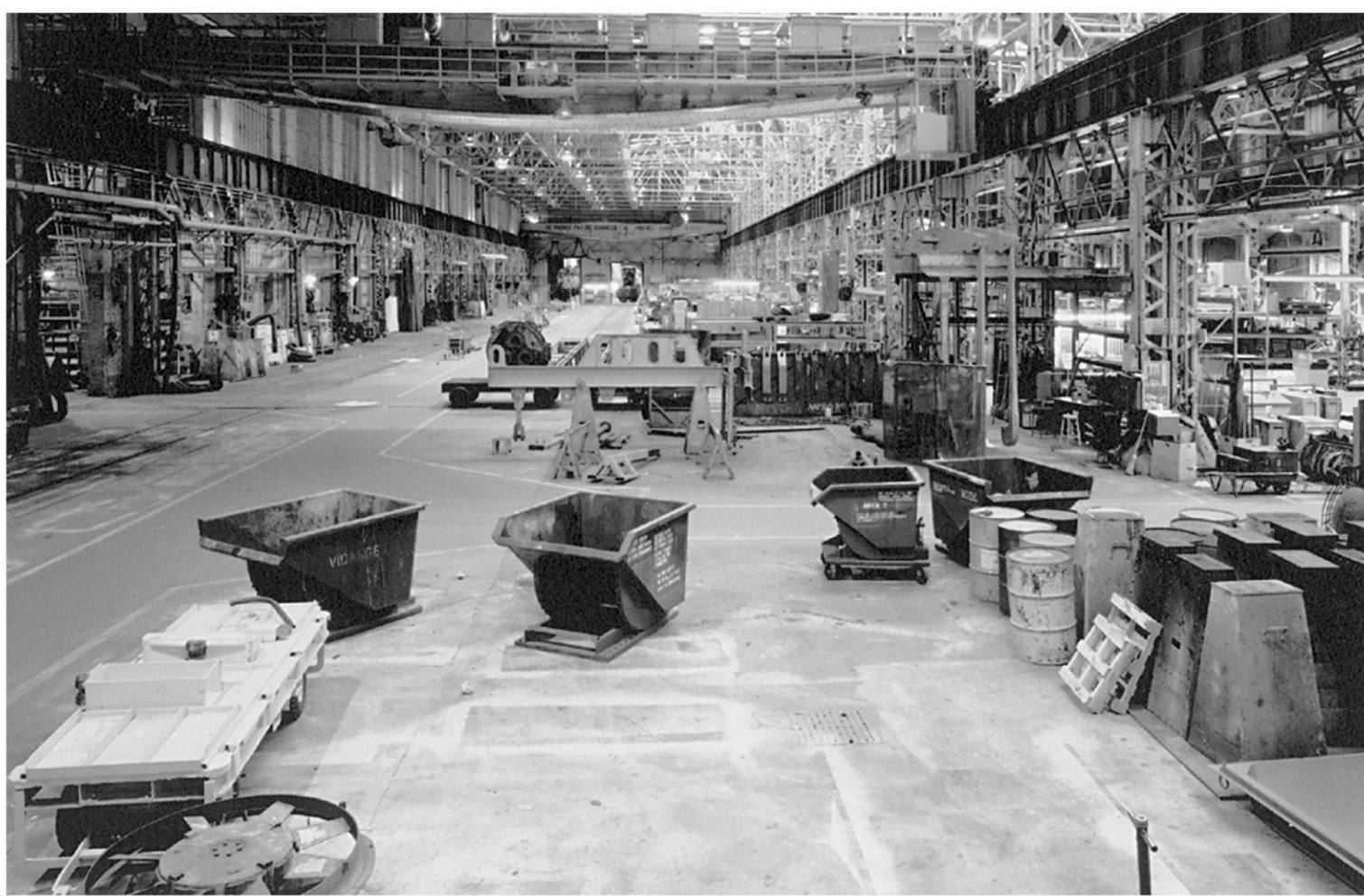
Guy Lafontaine, Locoshop, ateliers Angus (détail), vue d'est vers l'ouest, Montréal, 1991