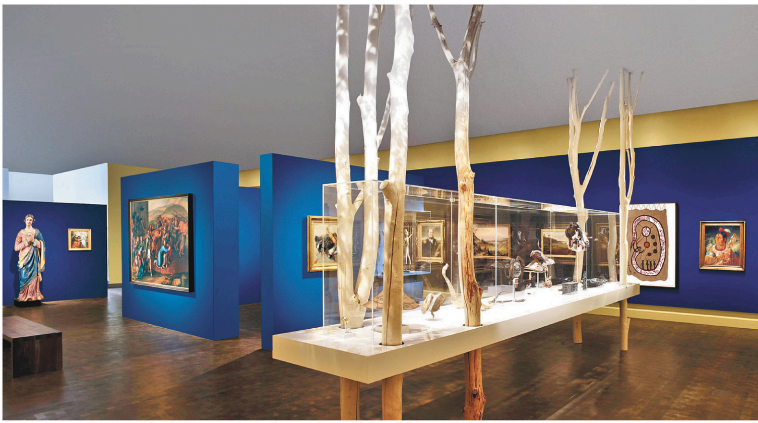
MARC CRAMER MUSÉE DES BEAUX-ARTS DE MONTRÉAL

Salle d'art québécois et canadien du pavillon Bourgie du Musée des beaux-arts de Montréal