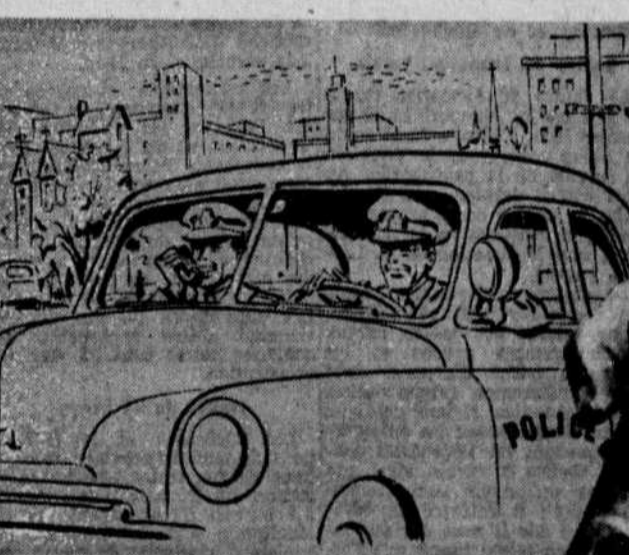
Ecoutez "Tambour battant" les mercredis et vendredis soir de 7h.30 à 7h.45 — réseau de Radio-Canada.

Jeunes gens, vous trouverez peu de causes plus dignes de votre appui que celle-ci. En la servant, vous aiderez aussi à protéger votre pays. Vous trouverez dans l'armée du Canada, en plus de l'occasion de faire votre devoir, des avantages innombrables. Venez aider à maintenir la paix dans le monde en vous enrôlant dès aujourd'hui dans votre armée!