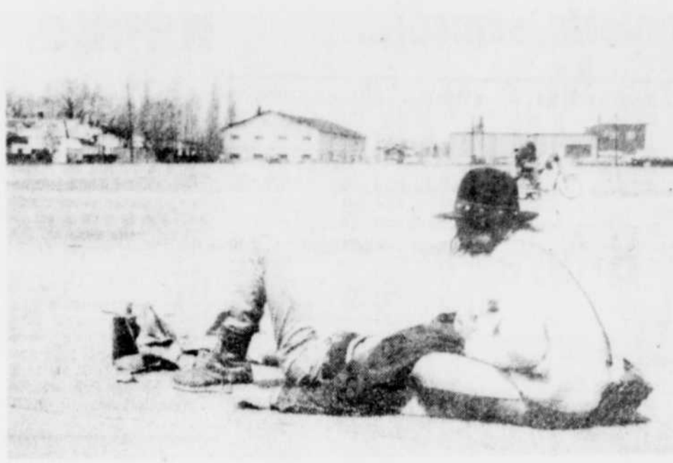
cheur du rallye Tiers-monde de Victoriaville qui reçoit un massage du visage, fort agréablement donné par sa petite amie.

● SOREL — La Commission scolaire de Sorel a accepté de louer à la Commission scolaire régionale Carignan des locaux situés dans les écoles élémentaires de son territoire afin d'y donner l'enseignement aux enfants qui éprouvent des difficultés d'apprentissage. Ainsi la régionale Carignan occupera trois classes à l'école Maria-Goretti, deux classes aux écoles Bernard et Saint-Viateur et un local aux écoles de Saint-Ours et Saint-Gabriel à Yamaska. Cet enseignement de niveau élémentaire est donné dans la région pour la Régionale Carignan, qui a pris charge de l'éducation des enfants handicapés mais intégrables.