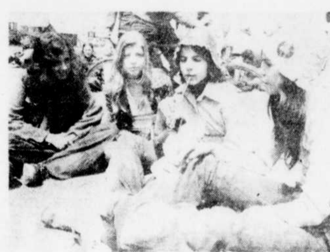
Après avoir bien marché pendant plus de 11 kilomètres, quoi de mieux qu'une bonne liqueur douce, bue à l'indienne.

du matériel), la République dominicaine (possibilité de financer une partie du plan Nagua, plan qui permettra aux paysans de régler certains problèmes face au développement), les organismes non-gouvernementaux (spécialement pour amoindrir les effets de la famine au Sahel), Haïti (financement pour la construction d'un centre professionnel), Victoriaville (aide financière à certains projets locaux), et enfin, le Brésil (continuer à aider le projet Alcántara).