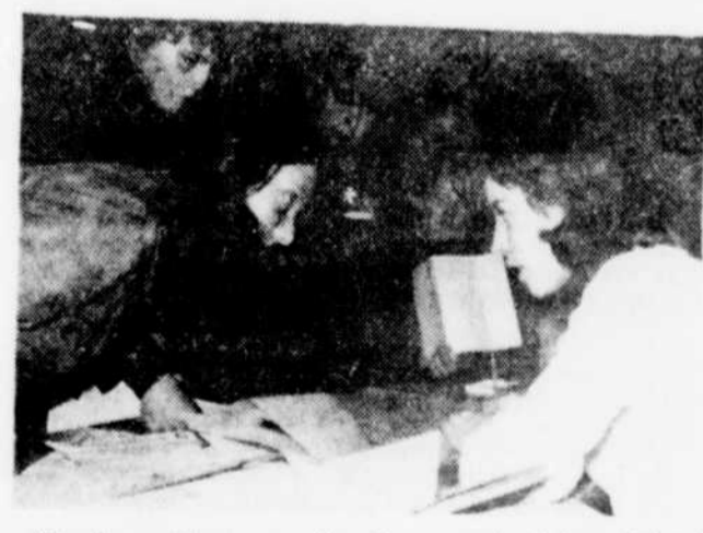
Afin de participer au rallye Tiers-monde, il faut d'abord s'inscrire après avoir obtenu le plus de commanditaires possible. On a vu des gens marcher pour $0.10 du kilomètre alors que d'autres marchaient pour $6.25 du kilomètre.