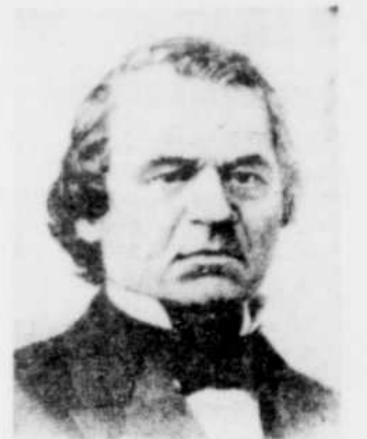
Andrew Johnson, il y a 107 ans, a déjà été l'objet de procédures semblables à celles dont Richard Nixon est le sujet actuellement.

Mme Eisenhower est restée très calme et très maîtresse d'elle-même pendant toute cette conférence de presse, sauf quand un journaliste lui a demandé si son père ne l'avait pas chargée de venir le défendre devant la presse.