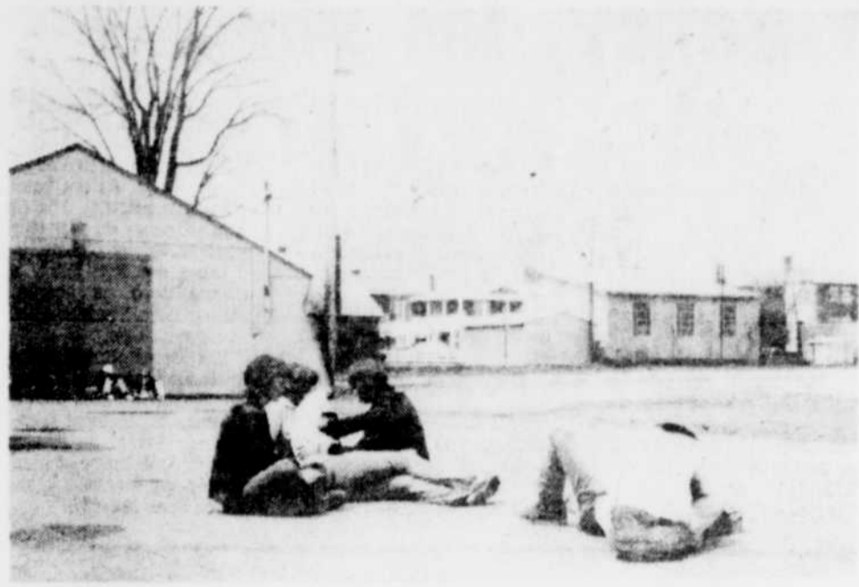
Si on regarde d'assez loin, photo de gauche, on croirait voir deux personnes blessées qui reçoivent la respiration artificielle à la façon bouche à bouche. De plus près, photo de droite, on peut facilement admettre qu'il s'agit d'un mar-