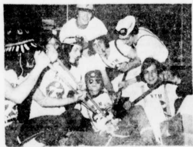
Le rallye Tiers-monde exige un nombre assez grand de bénévoles qui vont travailler dans la joie, la photo le démontre bien, pour faire de la marche, un succès. On voit ici l'équipe farfelue des éboueurs qui avaient comme tâche d'amasser tout ce qu'on laissait, principalement après le diner.