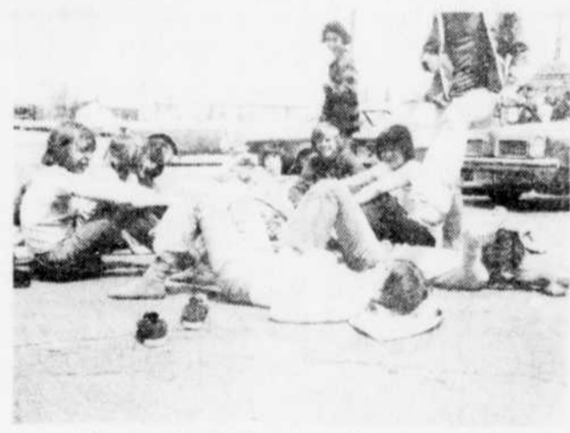
Les pieds, les pieds! Voilà l'outil le plus utile lors d'un rallye Tiers-monde. Il faut tout de même leur donner un petit répit, surtout lors du diner.