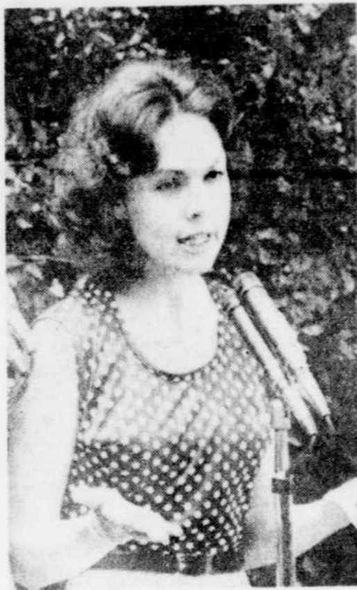
A la défense de son père

WASHINGTON (AFP) — Elle a révélé que M. Nixon avait parlé des rumeurs concernant sa démission au cours d'un dîner en famille vendredi soir sur le yacht présidentiel Sequoia pendant une courte croisière sur la rivière Potomac. "Il n'est absolument pas" question qu'il donne sa démission, a déclaré alors David Eisenhower, interrompant sa femme.