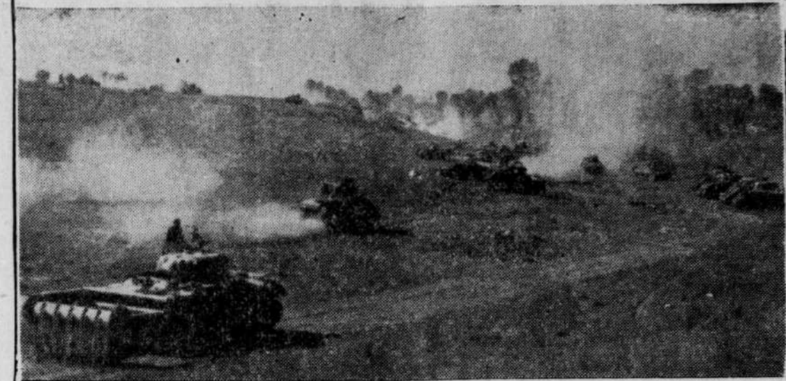
A travers des nuages de fumée et de poussière, un blindé canadien s'avance pour engager l'ennemi au nord de la trouée Falaise-Argentan.