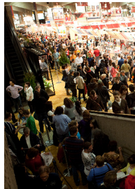
SALON DU LIVRE DE MONTRÉAL 2009

Soulignons que ces missions ont été organisées en collaboration avec les délégations générales du Québec à Londres et à New York, Québec Édition (ANEL), le MRI et la SODEC.