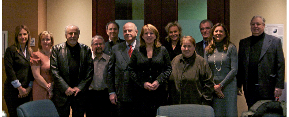
CHRISTINE ST-PIERRE, MINISTRE DE LA CULTURE, DES COMMUNICATIONS ET DE LA CONDITION FÉMININE ET LES MEMBRES DU CONSEIL D'ADMINISTRATION DE LA SODEC

la visite de Mme Christine St-Pierre, ministre de la Culture, des Communications et de la Condition féminine. Mme St-Pierre a également rencontré le conseil d'administration.