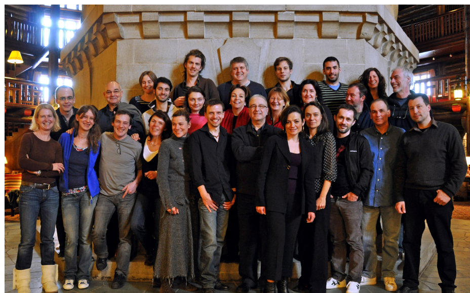
SCÉNARISTES ET SCÉNARISTES CONSULTANTS DU QUÉBEC, DE LA FRANCE, DE LA COMMUNAUTÉ FRANÇAISE DE BELGIQUE, DU GRAND-DUCHÉ DE LUXEMBOURG ET DE LA SUISSE AINSI QUE L'ÉQUIPE DE LA SODEC POUR ATELIER GRAND NORD

Atelier grand nord a comme partenaire important le Fonds Harold Greenberg d'Astral Media et bénéficie du soutien financier de partenaires francophones européens.