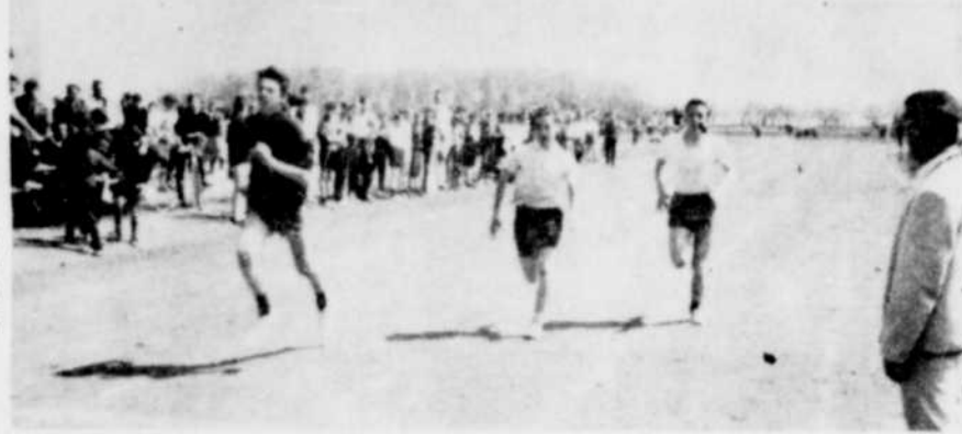
OLYMPIADES — Plus de 200 participants ont pris part, samedi dernier, au concours athlétique Inter-Régional en vue de déterminer les représentants de la région de Victoriaville samedi prochain. Sur cette photo, nous apercevons quelques participants qui s'apprêtent à passer le fil d'arrivée dans une épreuve de 100 verges.