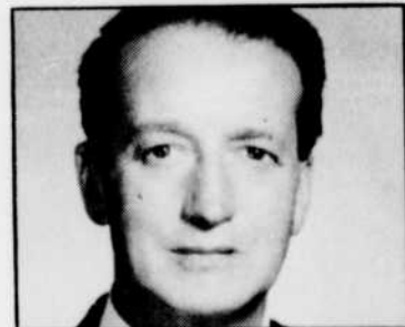
André MALAVOY parlera du Périgord, à «Carnet de voyage», à 16 h 07.