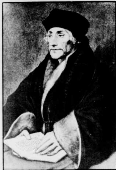
Erasme, par Holbein le Jeune

Erasme fonce et ébranle... mais avec douceur, équilibre, modération. Il est de toutes les réformes, pense à l'homme, à l'Europe, au monde, en créateur, et jette à profusion dans de multiples écrits des pensées et des idées qu'on croirait d'aujourd'hui. Il a horreur de la guerre, écrit la Complainte de la Paix et stigmatise l'Eglise, plus mondaine et guerrière que mystique. La guerre: «une injustice, puisque les pires bandits sont d'habitude les meilleurs guerriers». Et il se questionne sur ces papes qui en font leur sport préféré; vieillards décrépits qui se prennent pour des jeunes et oublient le Christ.