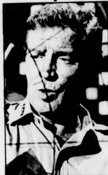
Richard BASEHART, dans «Voyage au fond des mers», VENDREDI à 19 h 30.