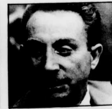
A «Pochades», du lundi au vendredi à 15 h 25: portrait de Charles TRENET.