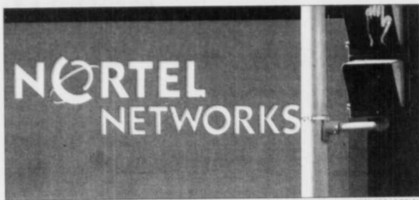
Nortel avait déjà indiqué qu'elle voulait se départir de ses activités manufacturières.