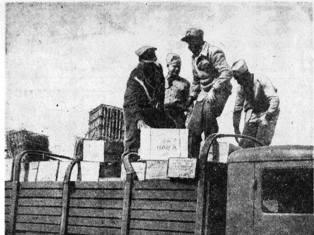
Grâce aux bons offices des Nations-Unies, les forces juives avaient permis qu'un convoi de vivres soit expédié à travers leurs lignes aux soldats égyptiens encerclés dans la poche de Falluja. Mais on voit ici des contrôleurs découvrant des caisses d'équipement militaire cachées parmi les vivres. Une partie du chargement fut confisquée et le convoi dut faire demi-tour. Ces caisses marquées "Haïti" avaient été confisquées quelque temps auparavant par les Égyptiens eux-mêmes à Alexandrie, à bord d'un cargo faisant route pour Haïti.