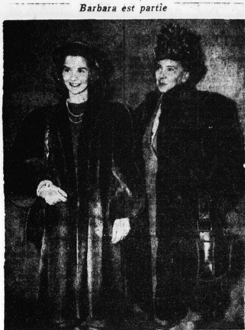
Barbara Ann Scott, en compagnie de sa mère, quittant dernièrement Montréal pour aller à New-York remplir son premier engagement professionnel au Roxy Théâtre.

10 cts la ligne comprise minimum 850 cts... Les annonces venant de l'étranger et réclamant un casier devront être accompagnées de 50 pour frais d'expédition du courrier.