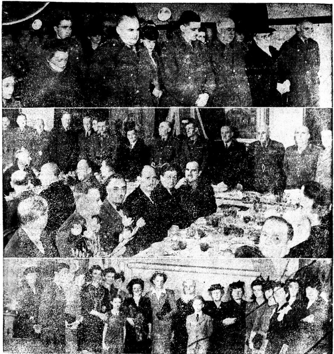
Photographies prises en fin de semaine, à l'occasion du passage à Québec du héros de Casa Berardi: en haut le major Triquet assiste à la messe à la Citadelle de Québec; au centre, déjeuner offert par les directeurs et les membres du club de la Garnison; au bas, réception à la famille Triquet par les membres du Chapitre Courcellette, auxiliaire du Royal 22 e Régiment.