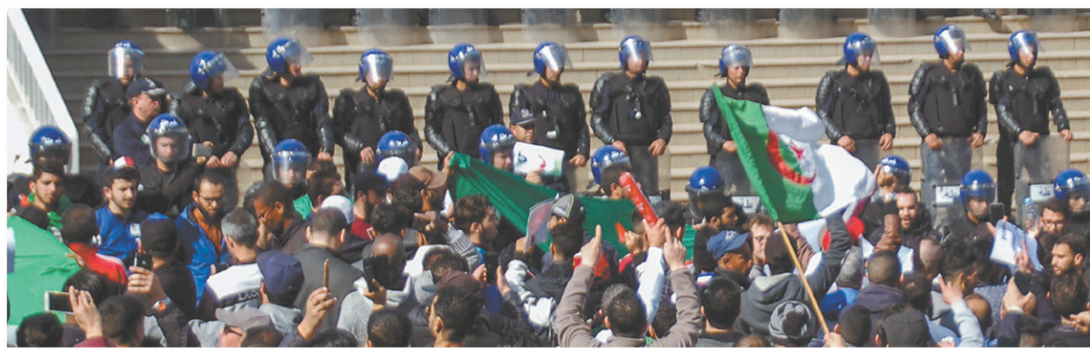
Une manifestation contre la candidature de Bouteflika le 1 er mars, à Oran