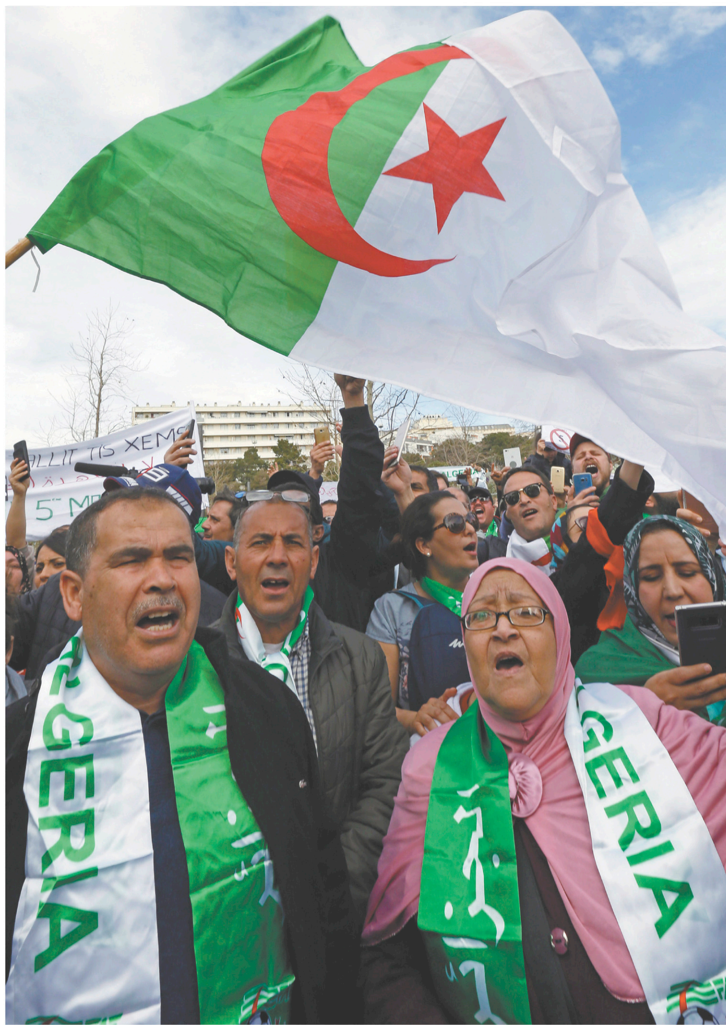
À Montréal comme à Paris (en photo), des centaines de manifestants se sont rassemblés dimanche pour exprimer leur farouche opposition à un 5 e mandat du président Abdelaziz Bouteflika, qui serait le symbole pour eux d'un « système illégitime et corrompu ».