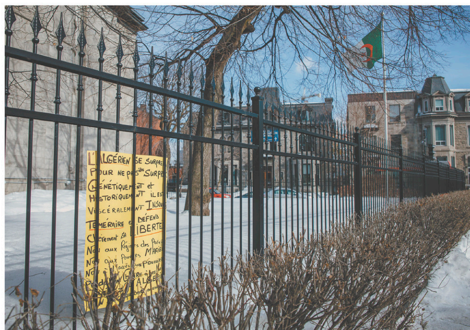
Des manifestants ont posé une affiche dénonçant le régime Bouteflika sur la clôture du consulat algérien, dimanche, à Montréal.

« Or, depuis plus de deux ans, en raison de la baisse du prix du pétrole, les recettes ne sont plus au rendez-vous, l'Algérie a donc été obligée de passer à la planche à billets, ce qui a fait croître l'inflation et causé la dévaluation du dinar », analyse le politologue.