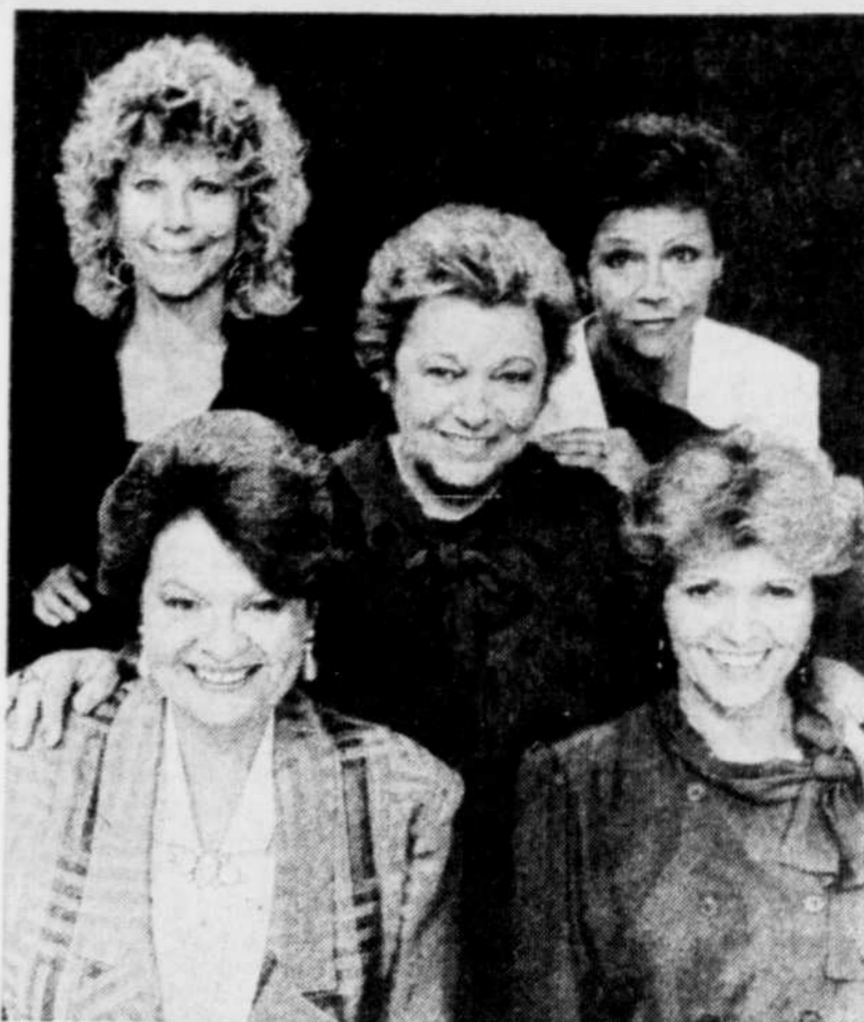
Les dames de coeur de Lise Payette sont encore loin des records de Rosanna et de Mère Bouchard.

Dernier point: il y a toujours environ cinq pour 100 plus de gens qui écoutent la télévision l'hiver qu'à l'automne, facteur dont on doit tenir compte si on analyse les résultats des deux saisons qui se suivent.