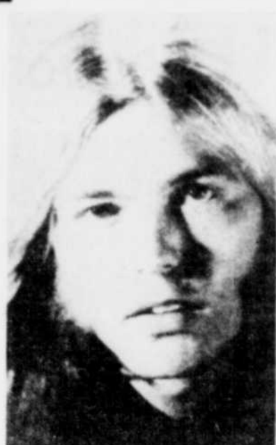
Gregg Allman revient, après six années d'absence sur disque.

Du rock sudiste d'autrefois il subsiste bien quelques traces ( I'm No Angel et It's Not My Cross To