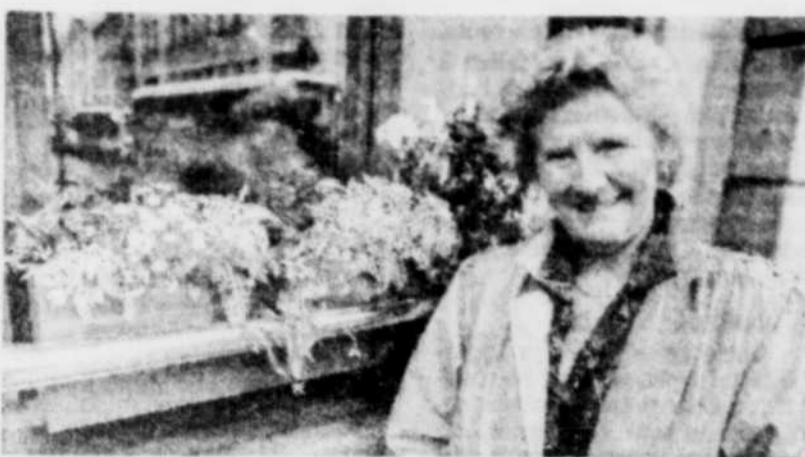
Antonine Maillet, entre mythe littéraire et réalité théâtrale.

Paris, il y a quelques années. Mme Maillet visite une librairie avec son éditeur français. Celui-ci