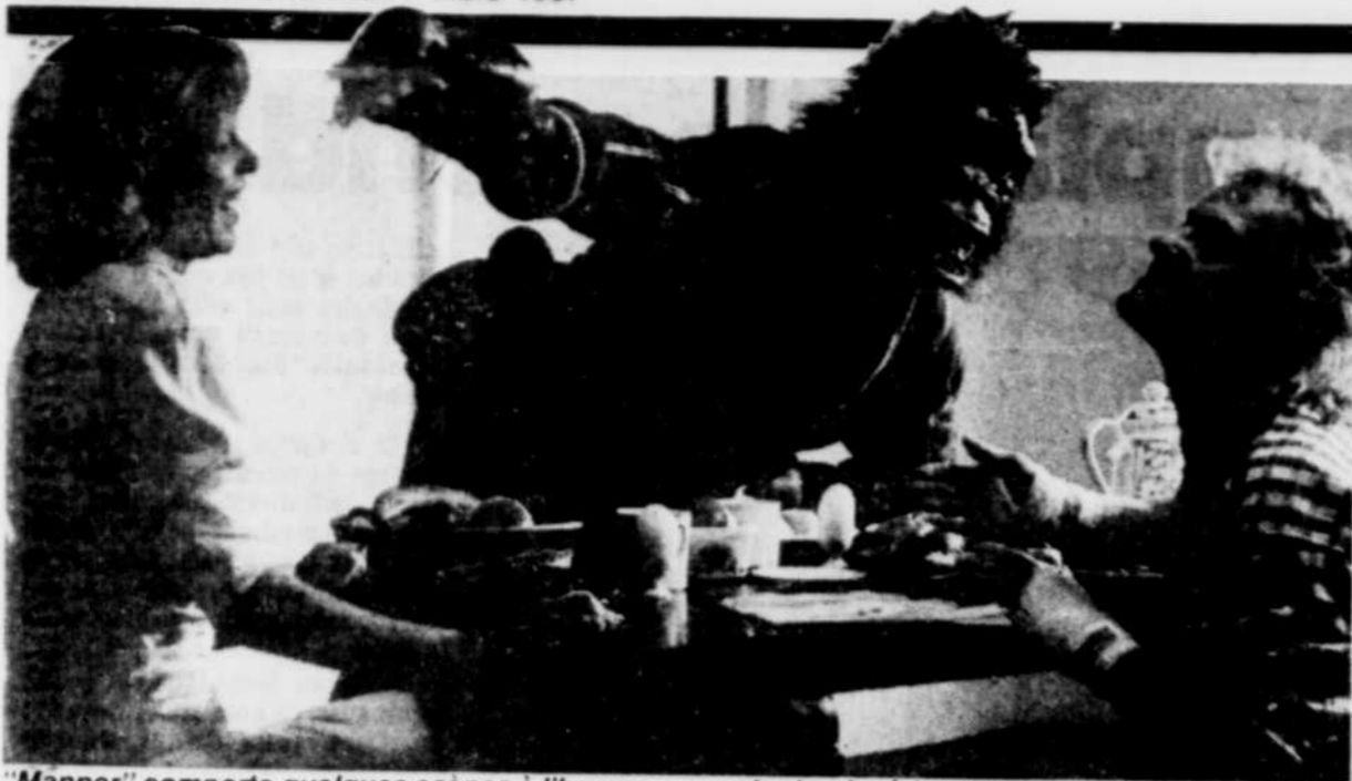
"Manner" comporte quelques scènes à l'humour percutant qui méritent de passer à l'anthologie du cinéma.