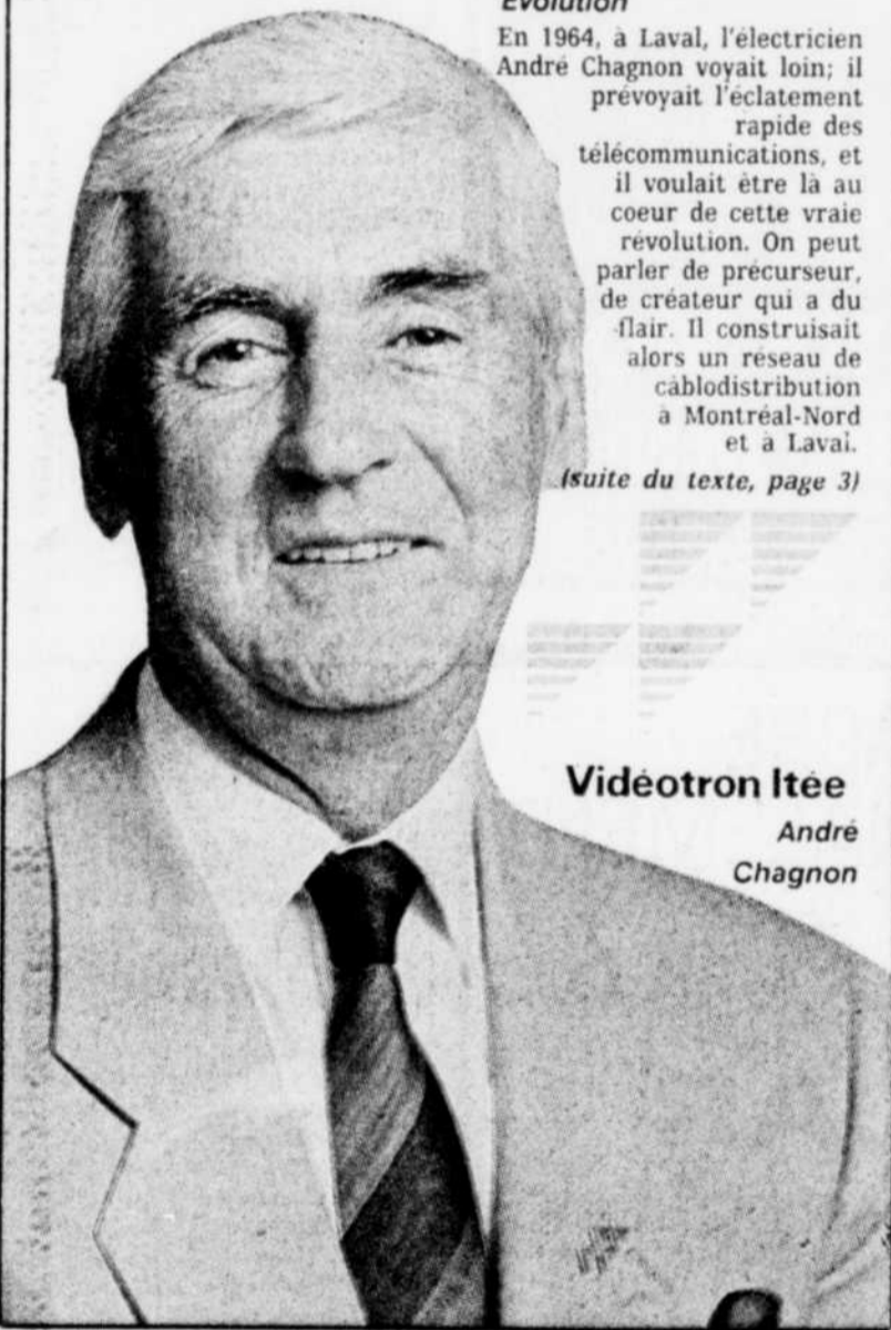
Vidéotron Itée André Chagnon