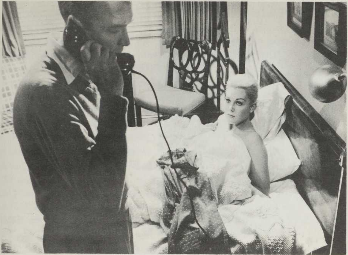
Hitchcock, "le farceur": VERTIGO

à ses détracteurs: "j'ai toujours été bourgeois, conservateur, réactionnaire,..." (Cahiers... no. 85, page 15).