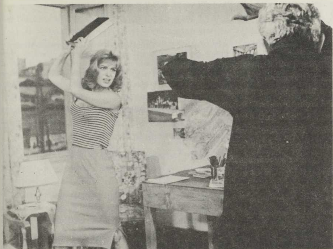
Melina Mercouri et Jules Dassin dans NEVER ON SUNDAY

que avec beaucoup d'aisance. Sa mise en scène, constamment "allegro vivace", est leste; il a su lui donner un rythme alerte qui fait fi des temps morts. Certaines séquences sont particulièrement bien enlevées: la réception du dimanche et le résumé de MÉDÉE par Ilya, la scène à la "taverna" où l'on brise les verres, la "marche" des prostituées pour protester contre la cherté de leur loyer et leur séjour en prison.