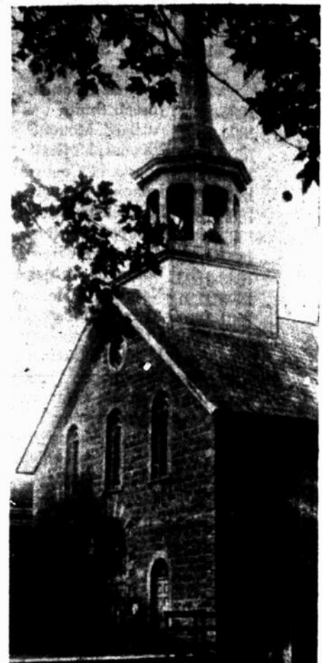
Une belle vue de l'église paroissiale et de son clocher.