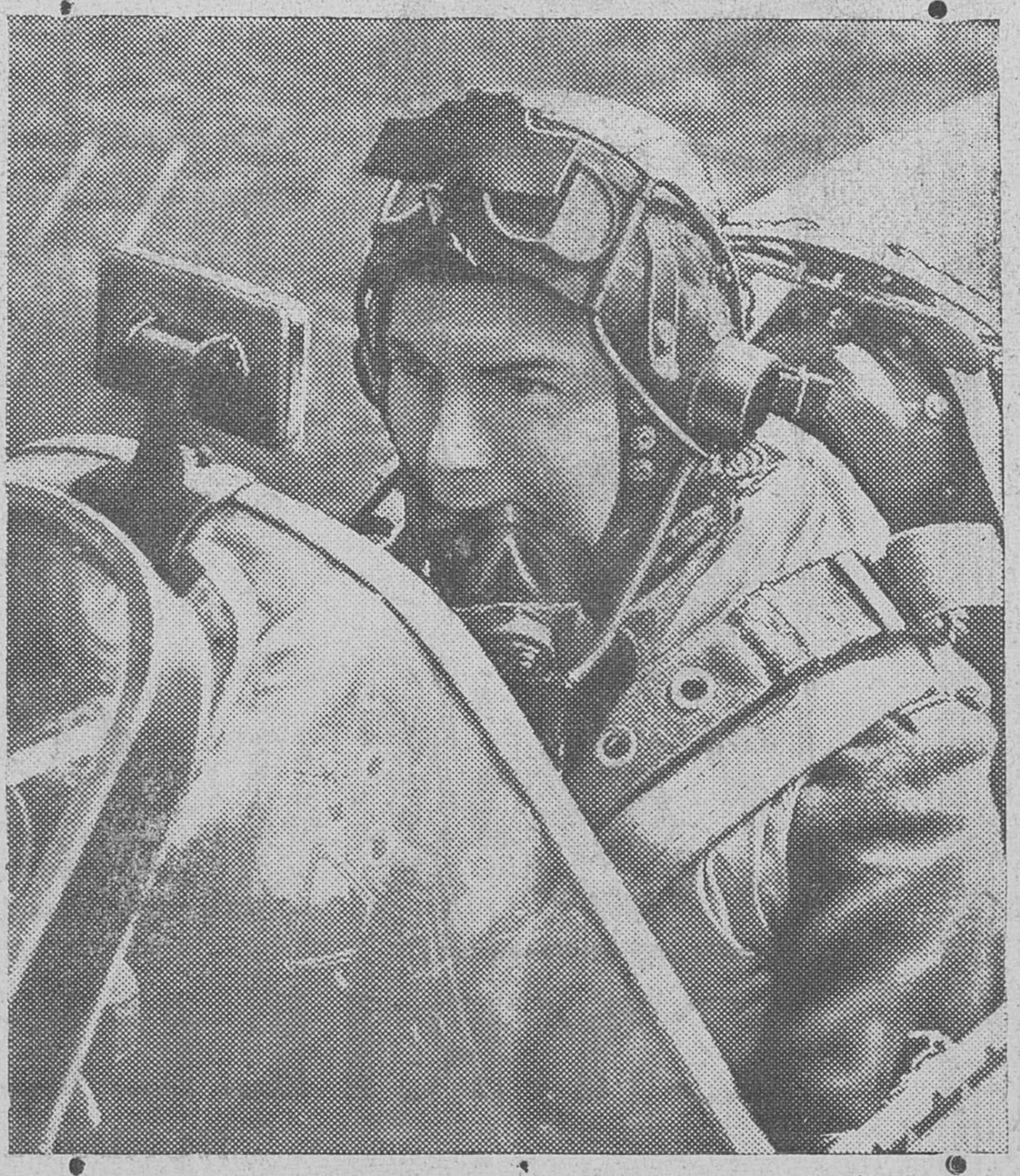
L'offensive aérienne britannique contre l'Allemagne aide la Russie en forçant les Nazis à garder dans l'Ouest la moitié de leurs avions de chasse. Sur cette photo, un pilote de chasse britannique dans la carlingue de son "Spitfire". Il est coiffé de son casque qui contient les écouteurs de T.S.F. et le respirateur à oxygène pour le vol à grande altitude.

Librairie Régionale, Inc. 12, avenue Labrecque Chicoutimi. Téléphone: 402. Connaissiez-vous la revue "MES FICHES"? Demandez un numéro spécimen.