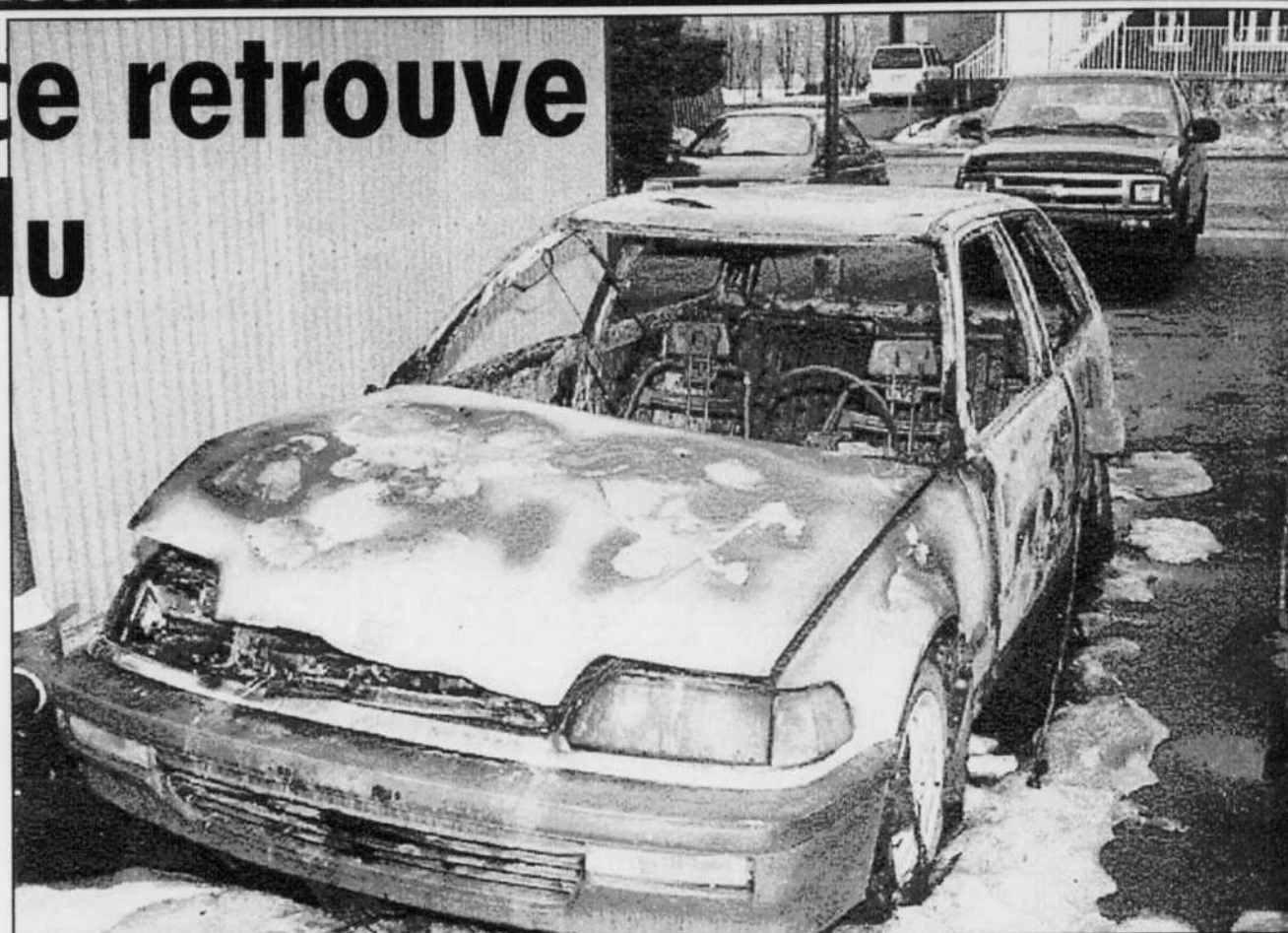
Le véhicule ayant servi au présumé agresseur de Me Jutras a été volé à Fleurimont le 27 février. On l'a retrouvé incendié. Cette Honda Civic blanche 1990 aurait été vue la veille et le jour même de l'agression aux alentours de la résidence de Me Jutras.

terminer le motif du crime est toujours en cours.