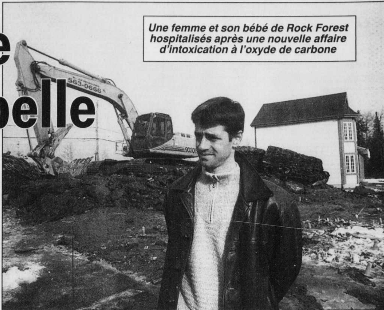
Une femme et son bébé de Rock Forest hospitalisés après une nouvelle affaire d'intoxication à l'oxyde de carbone

Sur description des symptômes, la personne préposée aux appels d'urgence a demandé aux occupants de quitter la maison et les a assurés qu'une équipe de pompiers se rendait sur place.