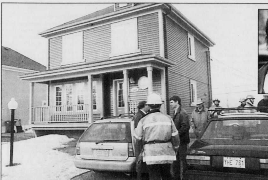
lisations de la ville.»

«Les seules émanations d'oxyde de carbone ont été relevées dans le sol du terrain vacant où des travaux de forage et de dynamitage ont eu lieu et dans la maison voisine, soit au 1608. Il n'y a eu aucune présence d'oxyde dans les cana-