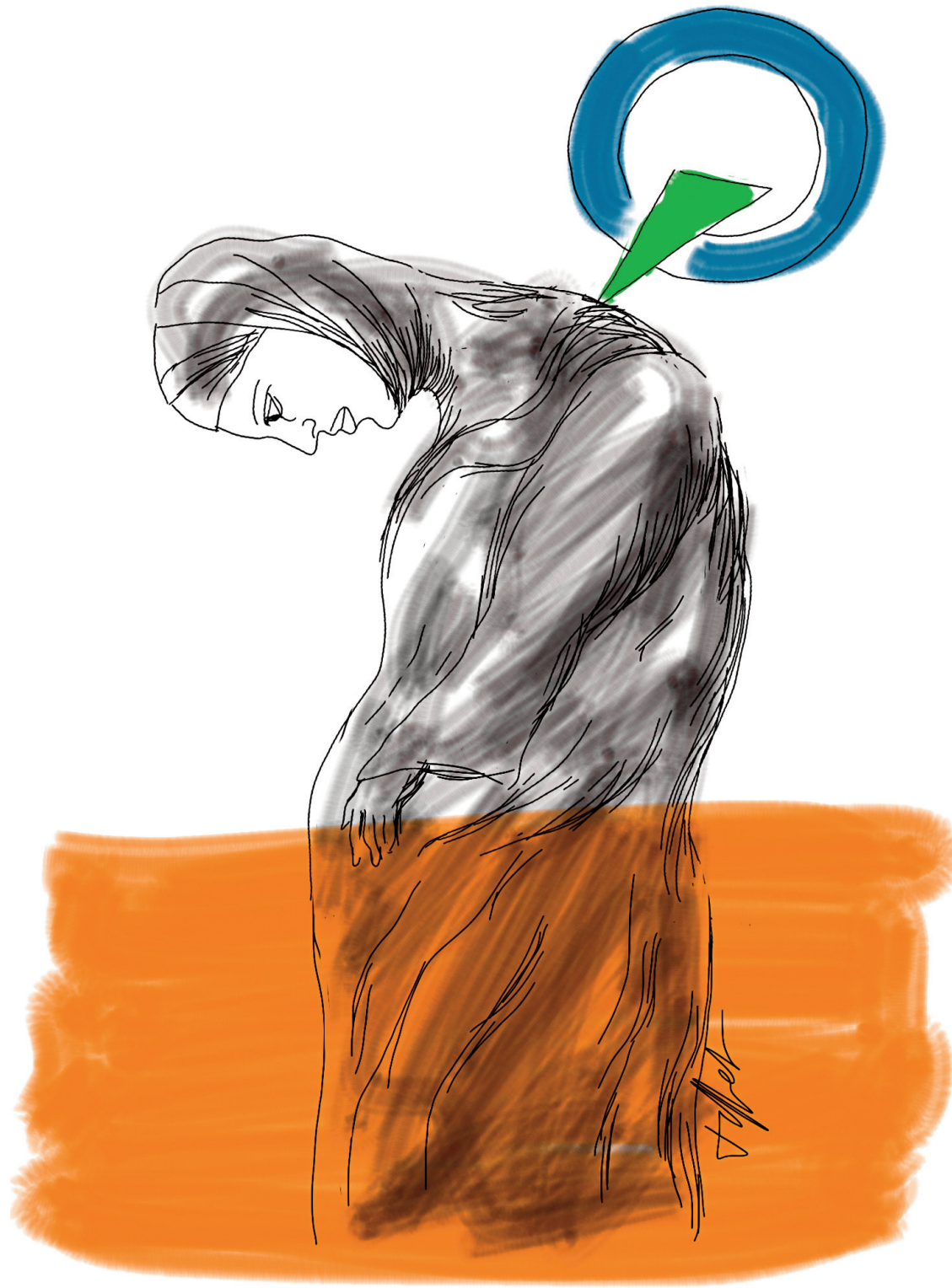
ILLUSTRATION CHRISTIAN TIFFET

Je ne connais pas chacun des 200 000 musulmans du Québec, mais tous ceux que je connais, pratiquants ou pas, ont vu le parachutage de l'auteure de Ma vie à contre-Coran comme une provocation. Comment réagiraient les chrétiens (les pratiquants ou même ces non-pratiquants qui veulent un crucifix à l'Assemblée nationale) à la candidature d'une personne dont le mérite le plus vanté serait un livre intitulé Ma vie à contre-Évangile ? À mon avis, les responsables de ce choix ne manifestent pas le jugement et la sensibilité requis par un projet aussi complexe et exigeant que l'accession du Québec à la souveraineté. Comme Maurice Duplessis, qui faisait lui aussi une partie de son beurre électoral sur le dos d'une minorité religieuse (les Té-