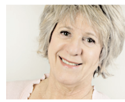
La chronique de Denise Bombardier fait relâche cette semaine.

Le Devoir se fait un plaisir de publier dans cette page les commentaires et les analyses de ses lecteurs. Étant donné l'abondance de courrier, nous vous demandons de limiter votre contribution à 800 caractères (y compris les espaces), ou 1100 mots. Inutile de nous téléphoner pour assurer le suivi de votre envoi : si le texte est retenu, nous communiquerons avec son auteur. Nous vous encourageons à utiliser le courriel (redaction@ledevoir.com) ou un autre support électronique, mais dans tous les cas, n'oubliez pas d'indiquer vos coordonnées complètes, y compris votre numéro de téléphone.