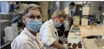
Emploi en demande dans la région

Le COFFRET (Mérédien 74) 181 rue Brière, Saint-Jérôme 450 565-2998 | lecoffret.ca