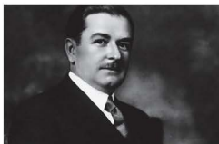
Maurice Duplessis, premier ministre du Québec de 1936 à 1939 puis de 1944 à 1959, voyait les syndicats comme subversifs.

Au 19 e siècle, l'industrialisation change tout. Bon nombre de paysans quittent les campagnes pour la ville, où ils peuvent trouver un emploi dans une usine. Mais les conditions de travail sont exécrables. Les ouvriers, qu'ils soient hommes, femmes ou enfants, travaillent 10 à 12 heures par jour, 6 jours par semaine, pour une maigre paie. Les accidents de travail, voire la mort, sont fréquents. Et il n'y a pas d'aide ou d'assurance pour les estropiés.