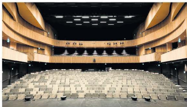
Le Théâtre Gilles-Vigneault à Saint-Jérôme.

« Nous sommes très reconnaissants de la générosité de notre clientèle et de leur participation au mouvement. Elle témoigne de l'attachement que nos clients ont envers le Théâtre et plus largement, le lien qui les unit aux arts de la scène », souligne