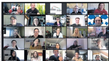
Des participants au 1 er Intercollégial des revues littéraires et artistiques.

C'était une journée radieuse dans les Laurentides, et surtout au Québec d'ailleurs. Cela n'a pas empêché une cinquantaine d'étudiants provenant de 11 cégeps de répondre à l'invitation du Cégep de Saint-Jérôme en prenant part, samedi dernier, au 1 er Intercollégial des revues littéraires et artistiques.