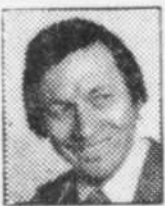
L'ÉDITO SPORT claude larochelle

Pauvre Irving Grundman! On lui a imposé le régime de la douche écossaise en fin de semaine dernière, de l'extrême chaud à l'extrême froid.