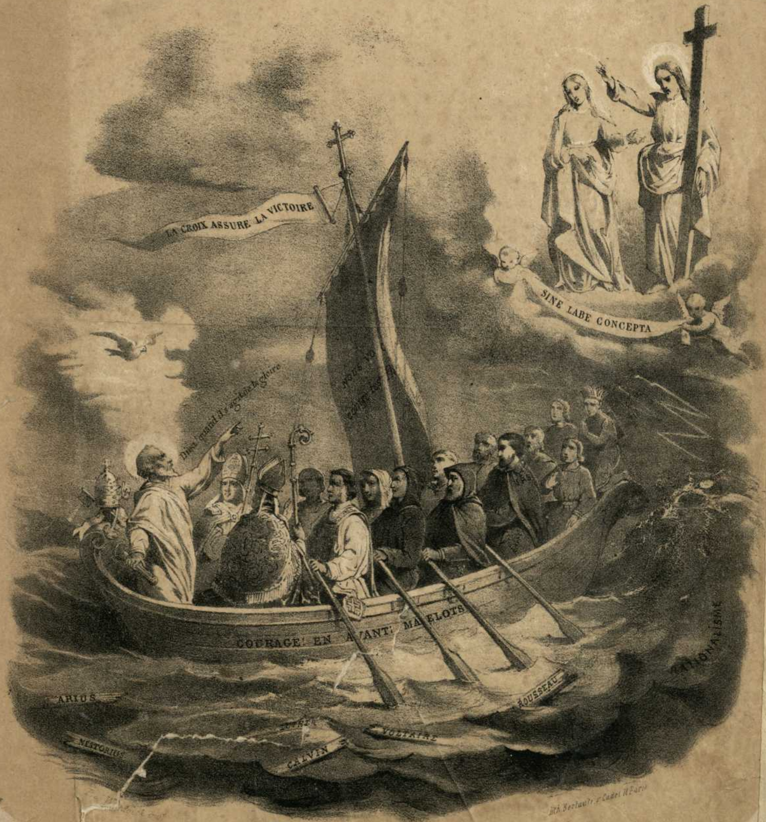
L'EGLISE SUR LA MER DU MONDE.