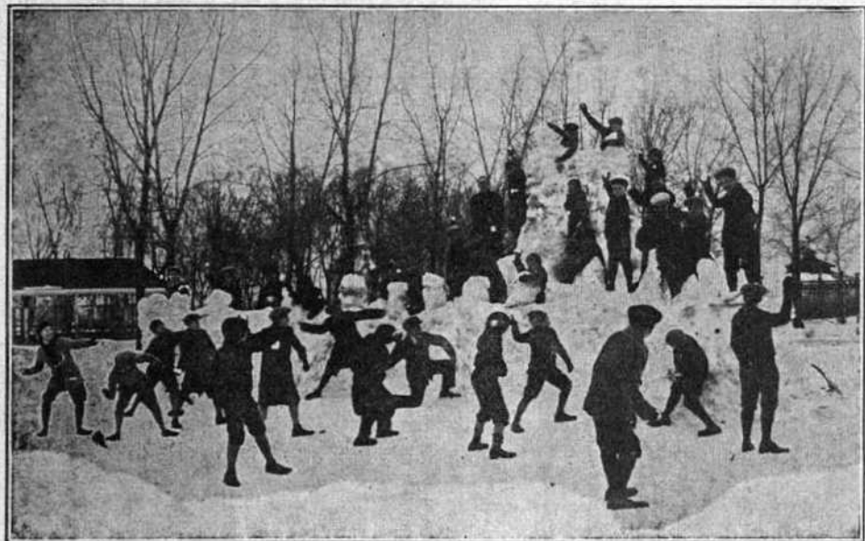
JUVÉNAT DE LAPRAIRIE — Une chaude (?) bataille où l'on brûle les dernières cartouches.