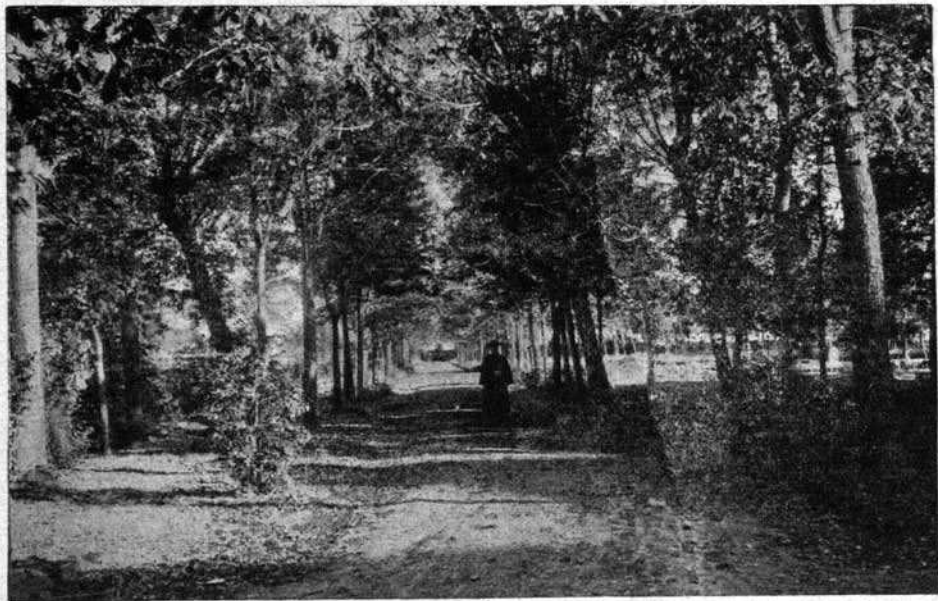
NOVICIAT DE LAPRAIRIE — Une des allées de la propriété.