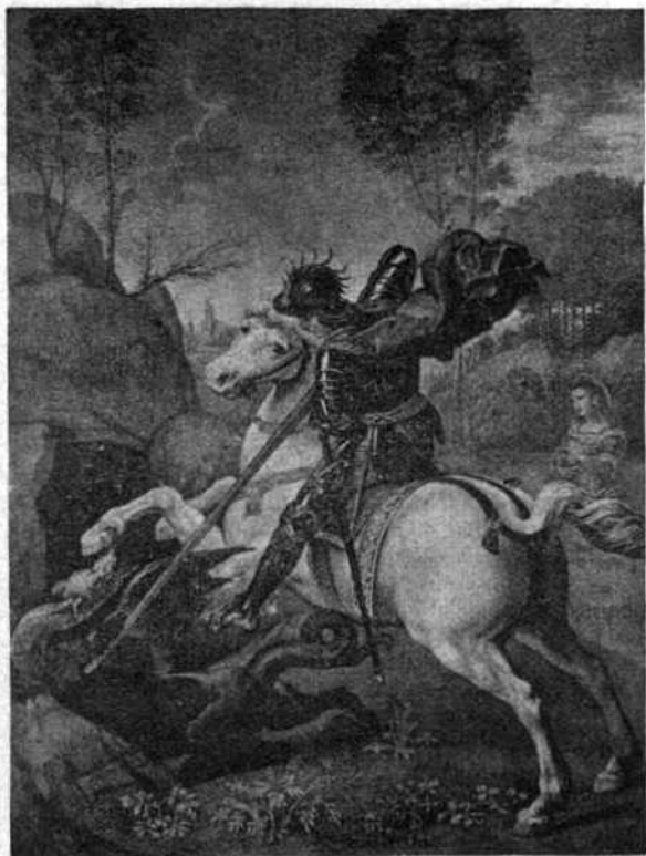
UN MODÈLE POUR LES "CROISÉS"

à vos frères et sœurs, aux camarades sur lesquels vous avez de l'influence. Il est intolérable de voir un si grand nombre d'enfants chrétiens se nuire ainsi gravement les