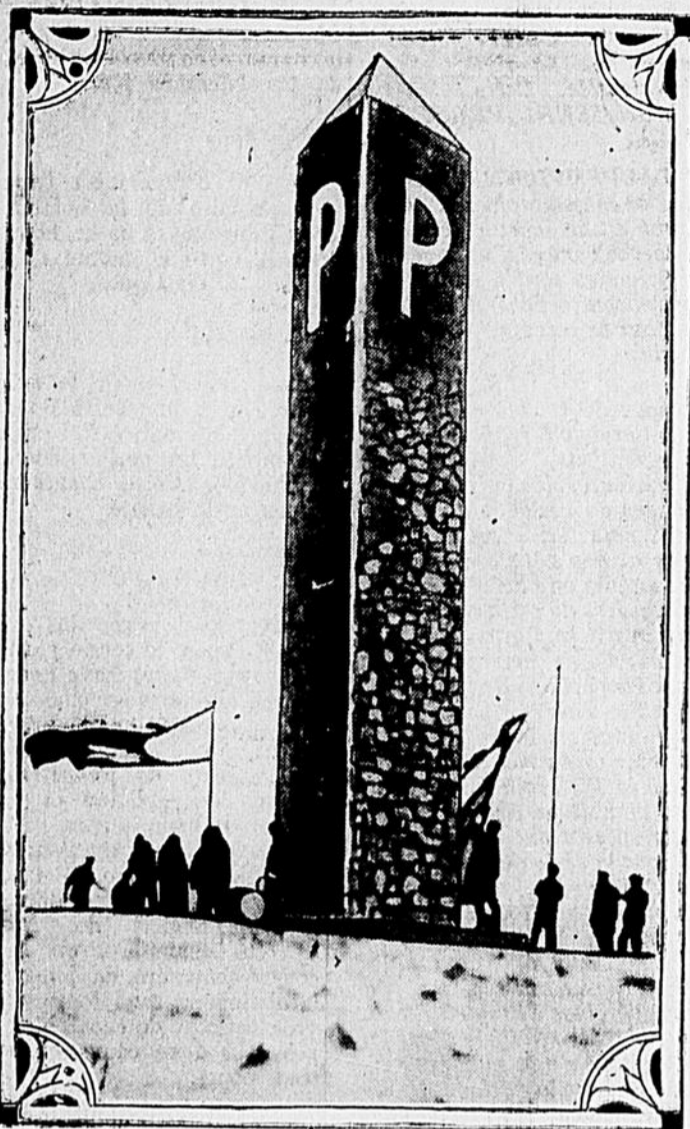
Monument élevé à la mémoire de l'explorateur et découvreur du Pôle Nord, l'amiral Peary. Il est situé sur une élévation du Cap York, Groënland.