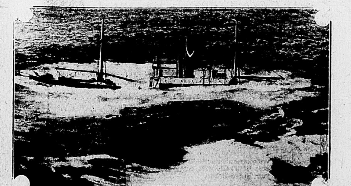
Le vapeur Glamorgan, frappa un récif près de Land's End, Angleterre. Les vagues étaient si fortes que tout sauvetage fut impossible.