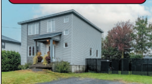
Maison 26x26 construite en 2013 avec la certification novoclimat, 3 chambres. Grand patio 12 x 18, pergola, terrain paysager et clôturé de plus de 9 750 pi². Disponible rapidement. 279,500$