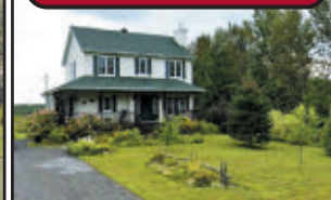
Impeccable, maison 28 x 33 construite en 2006, 11 pièces dont 2 chambres. Patio, terrain paysager de 30 700 pi².