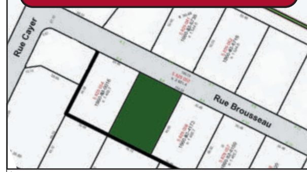
$3.50 le pi² Dernier terrain résidentiel de plus de 15,095 pi² prêt à construire cette année. Service d'égout et pluvial de la municipalité, idéal pour autoconstruction. 52,800$