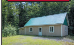
Terre à bois 25 arpents, bois mixtes, bâtiment pour cabane à sucre 18x32 construit en 2016. Facile d'accès.