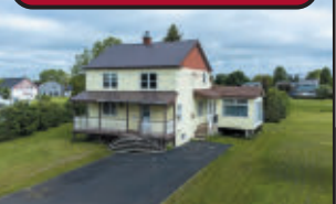
Maison à étage 24x30, 4 c.c. Solarium, remise, beau terrain paysager de plus de 13 690 pi², présentement libre.