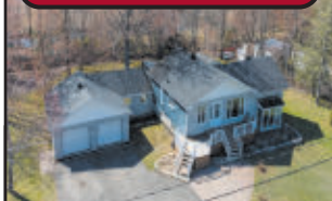
Vue sur le Lac des Sources, maison 28x37, 2 c.c. Remise 12x14, patio 12x26, garage attaché 22x24, terrain 24 000 pi².