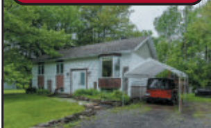
Maison 24x40, 4 c.c. Patio, remise 6x8, gazebo, garage 20x30, piscine hors-terre, terrain paysager de plus de 18 340 pi².