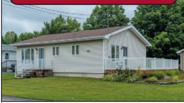
Maison 26x38, 2 chambres, très bien entretenue. Patio 12x25, remise 10 x 12, terrain paysager de plus de 7 100 pi² sur coin de rue. C'est à voir ! Disponible pour octobre. 199,500$