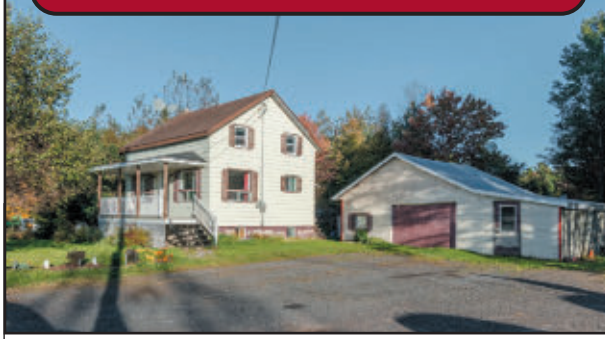
Maison de campagne 20 x 22, 3 chambres. Garage 24 x 30 incluant une remise, terrain paysager de plus de 12 700 pi² en zone agricole, à proximité de l'autoroute 20. 164,500$