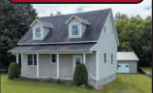
Maison 24x30, 5 c.c. Garage détaché 24x30, terrain paysager de 13,080 pi², îlot déstructuré en zone agricole.