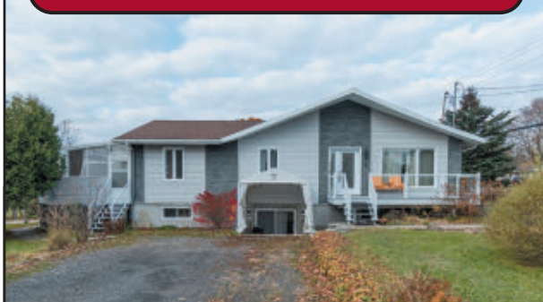
Triplex 47 x 57 comprenant 2 x 4½ pièces et un 5½ pièces pour le propriétaire occupant. Possibilité de revenu de 23 436$ par année. Disponible pour septembre. 365,000$