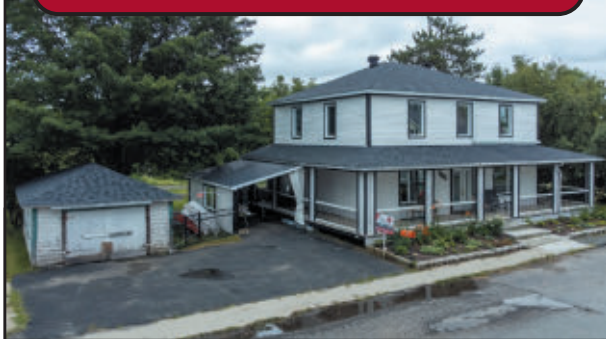
Belle maison 28 x 36 rénoverée, 5 chambres, plafonds à 9 pieds en tuiles de tôle embossée. Abri d'auto 14x19, garage 14x22, terrain paysager de 13 500 pi², sur coin de rue. 249,500$

Évaluation gratuite de la valeur marchande de votre propriété