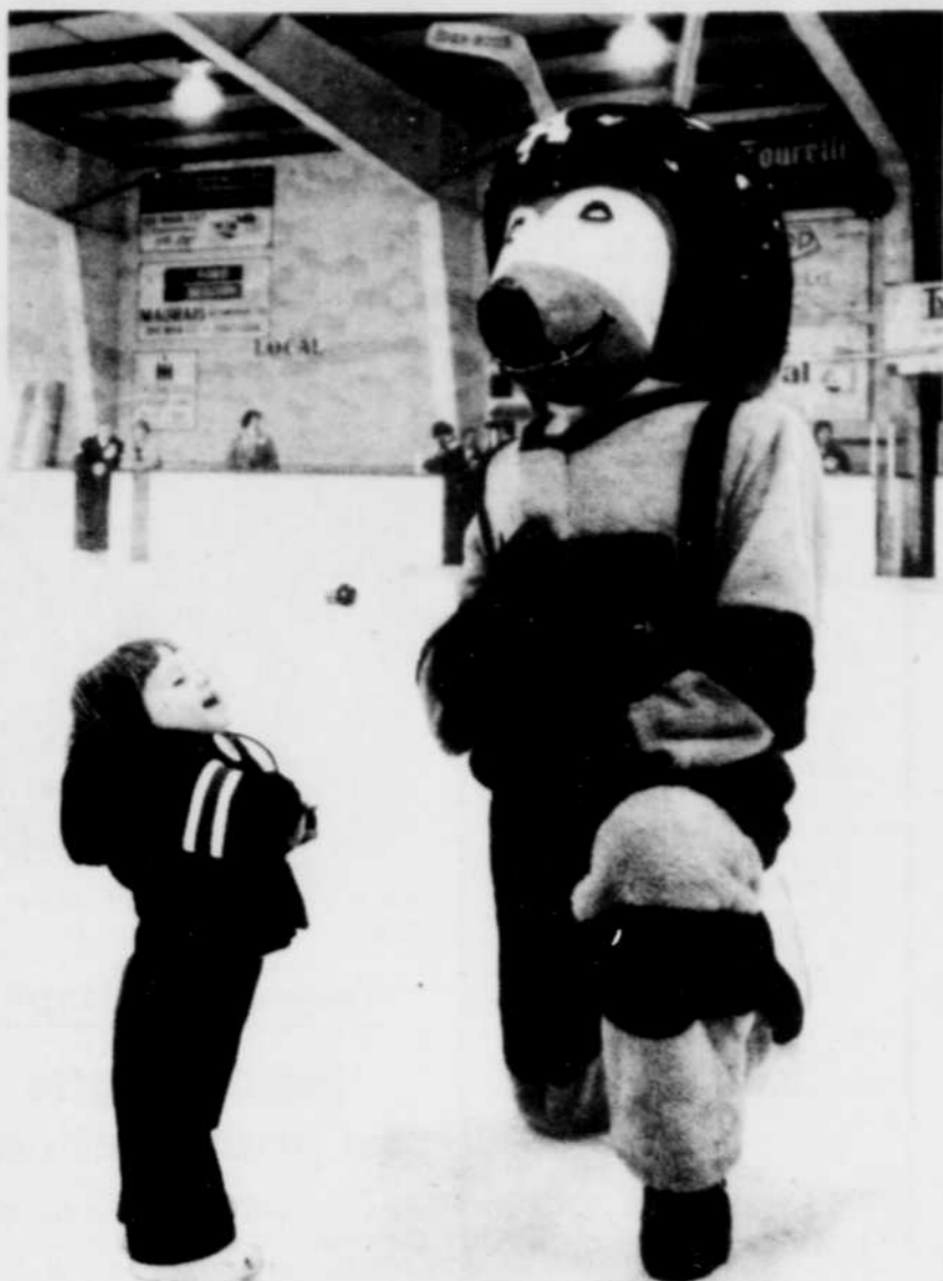
Atomousse en compagnie d'un jeune fan...