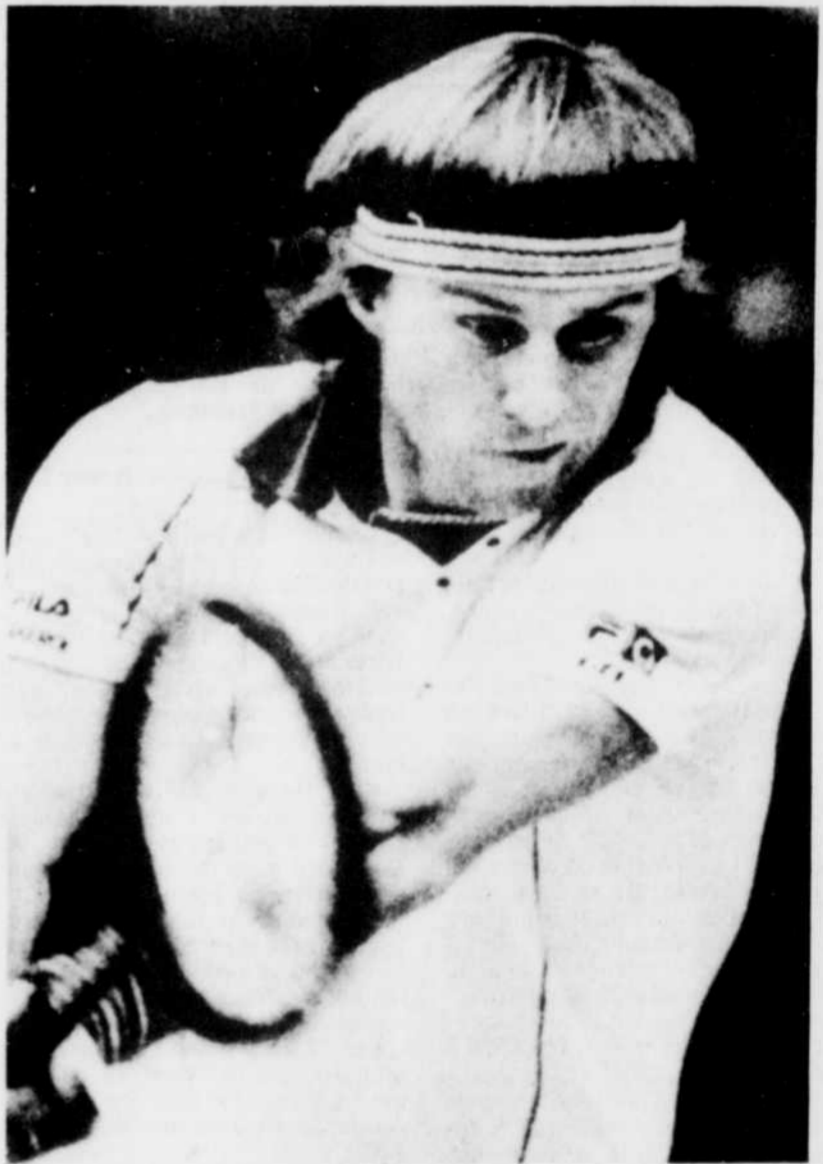
Bjorn Borg annonce sa retraite...