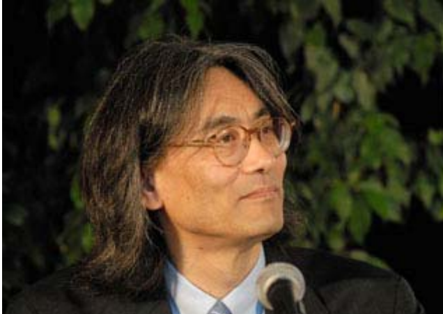
Le chef Kent Nagano