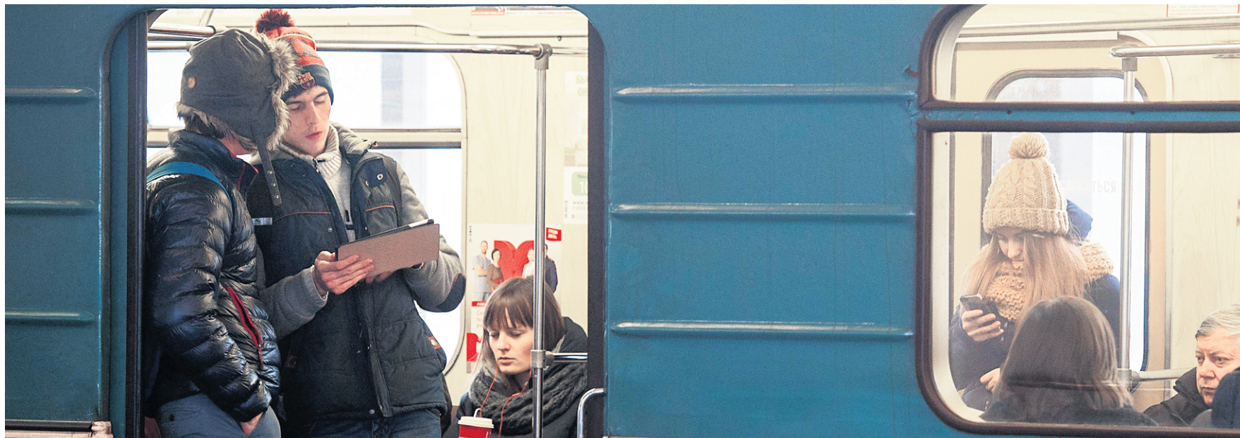
Depuis les premières mises en service il y a un an, les accros aux téléphones intelligents et tablettes numériques de Moscou ont pris l'habitude de consulter gratuitement leurs courriers électroniques, les réseaux sociaux ou les sites d'informations dans leurs trajets quotidiens en métro.