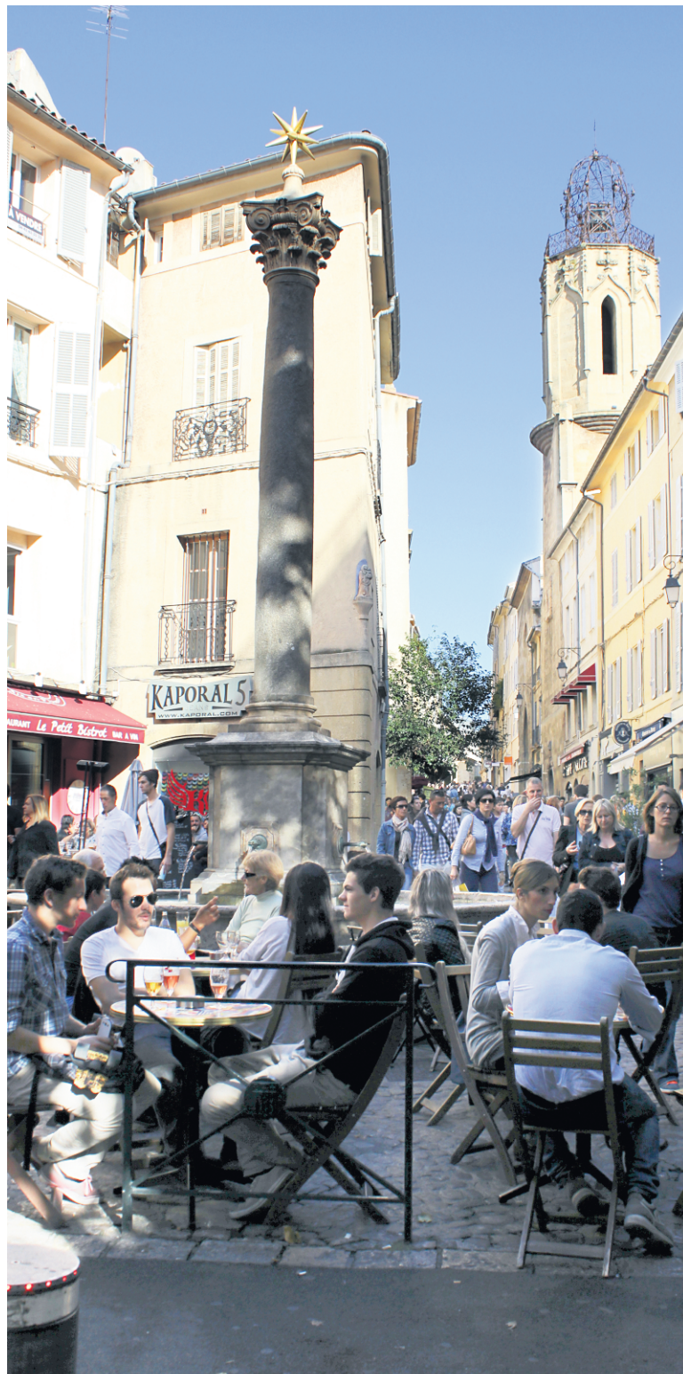
À taille humaine, le centre-ville historique et piétonnier d'Aix-en-Provence réserve de belles découvertes, comme la petite place des Augustins.

Les amateurs de magasinage seront bien servis à Aix. Pour une ville si petite, il est d'ailleurs étonnant d'y découvrir à peu près toutes les marques françaises les plus branchées (Sandro, Zadig et Voltaire, Maje, Comptoir des cotonniers, Sessùn) et les plus chics (Gérard Darel, Sonia Rykiel, Zapa, Repetto). Une bonne indication, donc, du pouvoir d'achat des Aixoïses... La plupart des boutiques se concentrent dans le centre-ville, dans la rue Espariat, la rue Marius Reynaud, la rue Aude ou la rue Méjanes, mais aussi dans le nouveau quartier shopping des Allées provençales. Pour rapporter un petit peu de Provence dans sa valise, plusieurs boutiques de la rue Gaston de Saporta proposent des produits régionaux : savon de Marseille, tapenade, lavande, huiles d'olive, etc.