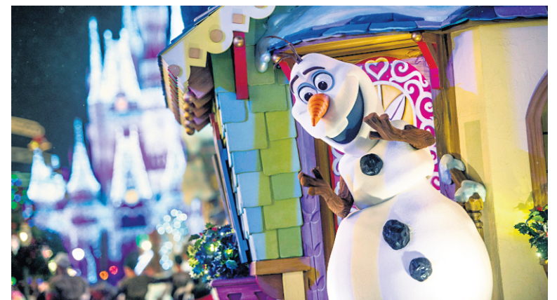
La reine des neiges Elsa — qui sera du défilé de Noël avec sa sœur, la princesse Anna — transforme le château de Cendrillon en palais de glace tous les soirs, avec effets de lumière, musique et feux d'artifice. Le bonhomme de neige Olaf sera aussi de la partie.