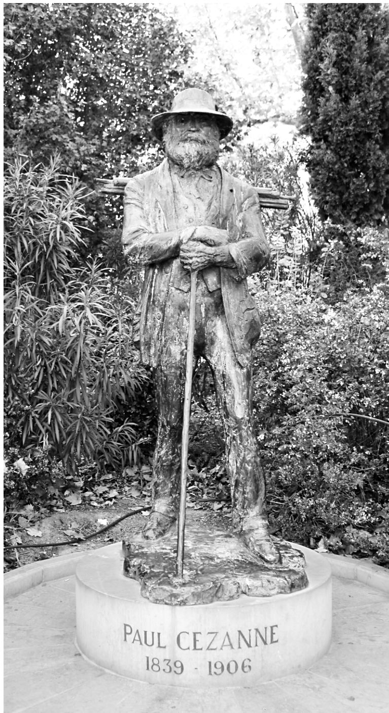
Le fantôme du célèbre peintre Paul Cézanne plane toujours sur Aix-en-Provence.