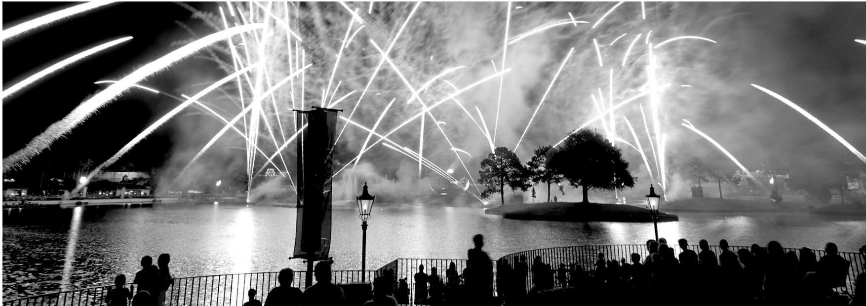
Les lumières sont à l'honneur à Disney, particulièrement à Epcot où 11 pays fêtent Noël.