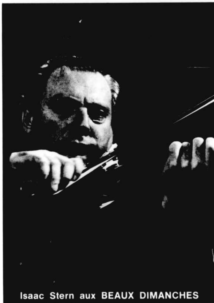
Isaac Stern aux BEAUX DIMANCHES