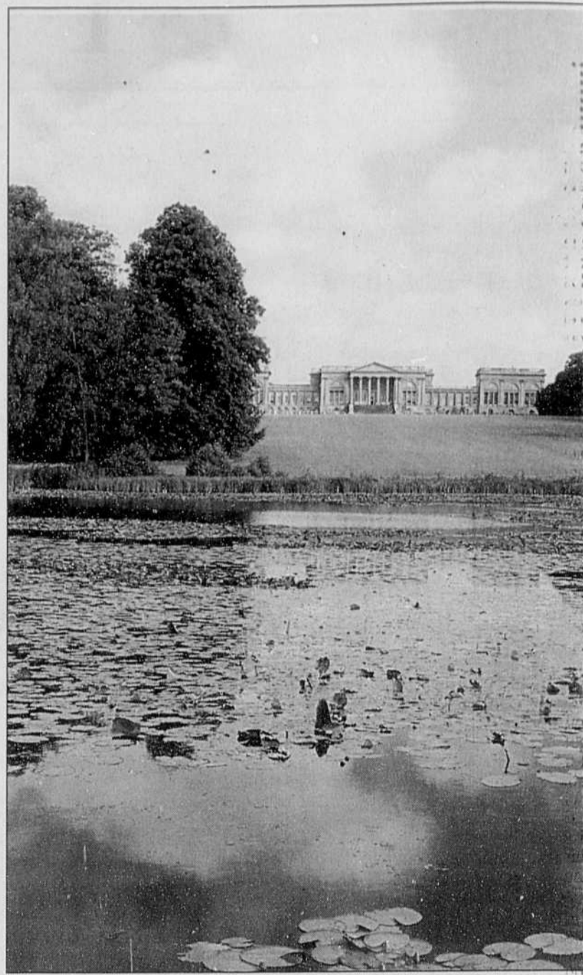
Disons oui à l'entretien de la pelouse si le château vient avec... SOURCE: L'ARCHITECTURE DES JARDINS D'EUROPE

■ Lectures: Protégez votre jardin, des Publications du Québec. Toujours un classique pour l'identification rapide des problèmes. On y a la gâchette facile pour l'utilisation des pesticides, cependant. Jardiner tout naturellement , aussi des Publications du Québec (7,95 $). Des trucs bio et un bon programme d'entretien des pelouses — voir notamment le diagramme sur l'effet de la hauteur de tonte sur le pourcentage de mauvaises herbes. Mais peu de renseignements pour l'identification des ravageurs et maladies. La liste des plantes compagnes semble plus basée sur le folklore que sur des données scientifiques.