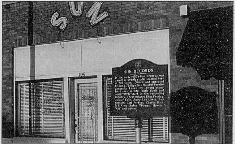
Musée le jour, studio actif la nuit, Sun brille toujours.

Sur Internet, Memphis Mojo, un guide électronique sur la musique de cette historique ville: http://www.memphismojo.com/