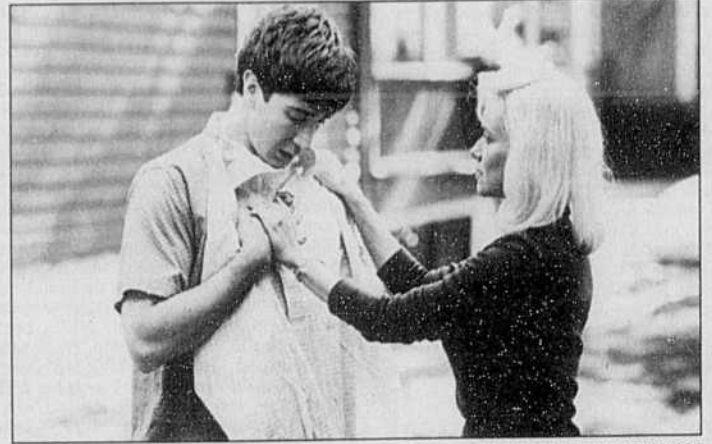
David Schwimmer et Barbara Hershey, dans The Pallbearer.

Tant qu'à verser dans la satire, il eut mieux valu dessiner tout le monde avec des couleurs burlesques et enfoncer la pédale comique. Ou bien aller dans les teintes pastels de la romance et creuser le registre sensible. A cheval entre les deux tons sans parvenir à en adopter un, en l'absence de réparties spirituelles ou même intéressantes, sans que les comédiens ne se sentent à l'aise dans la peau de ces personnages insignifiants ou caricaturés; c'est un portrait en creux d'une Amérique immature, puritaine et insignifiante que ce film trace, sous couvert de comédie. Peut-être les très jeunes adultes goûteront-ils cet univers d'arrière-émotions, mais il y a fort à croire que The Pallbearer correspond davantage aux réalités anglo-saxonnes de high schools et qu'ici les enfants des polyvalentes et des cégeps trouveront ce jeu des Américains bien empoités.