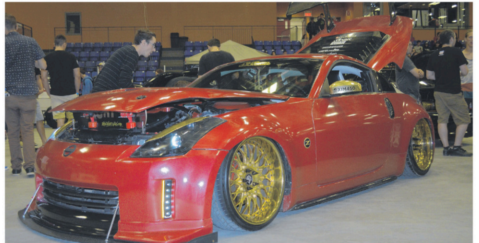
La pluie avait gâché l'ambiance à l'extérieur l'an dernier, mais le Centre Caztel avait plusieurs belles machines entre ses murs.

En soirée, les organisateurs souhaitent « finir ça en beauté » avec de la musique techno/électro sous le chapiteau, avec plusieurs Dj de