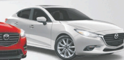
Modèle GT illustré