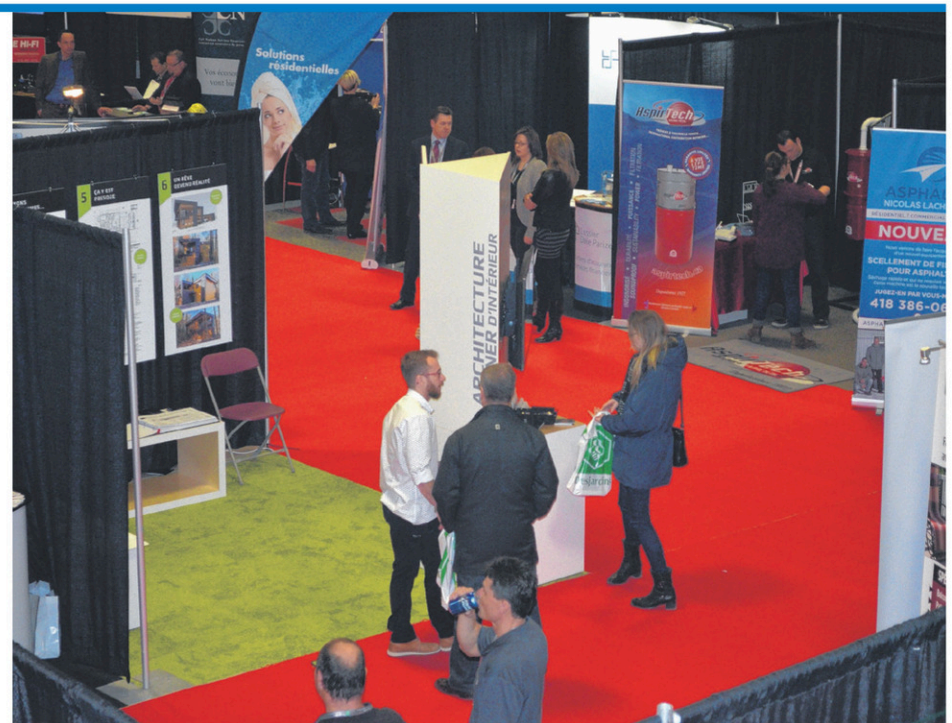
Exposants et visiteurs ont été ravis, tout au long du week-end.