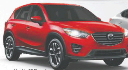
Modèle GT illustré