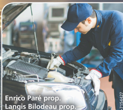
Enrico Paré prop. Langis Bilodeau prop.

1163, Notre-Dame Nord, Sainte-Marie • 418 387-2612