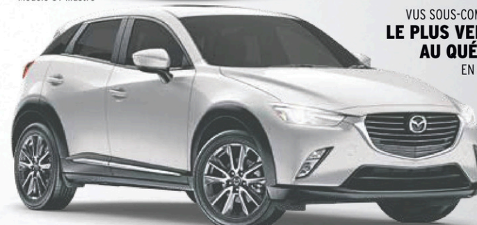
Modèle GT illustré

VUS SOUS-COMPACT LE PLUS VENDU AU QUÉBEC EN 2016 ††