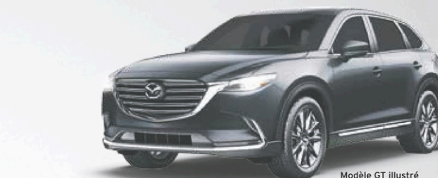
Modèle GT illustré