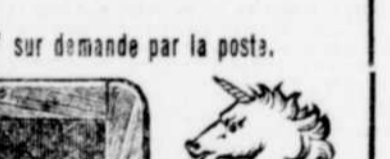
THE SLATER SHOE

Catalogue "pour femmes" sur demande par la poste.