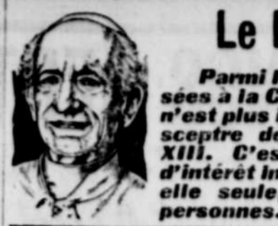
Le Pape Léon XIII

Parmi les couronnes qui sont exposées à la Cie S. Carsley Limited, aucune n'est plus intéressante que la tiare et le sceptre de sa Sainteté le Pape Léon XIII.