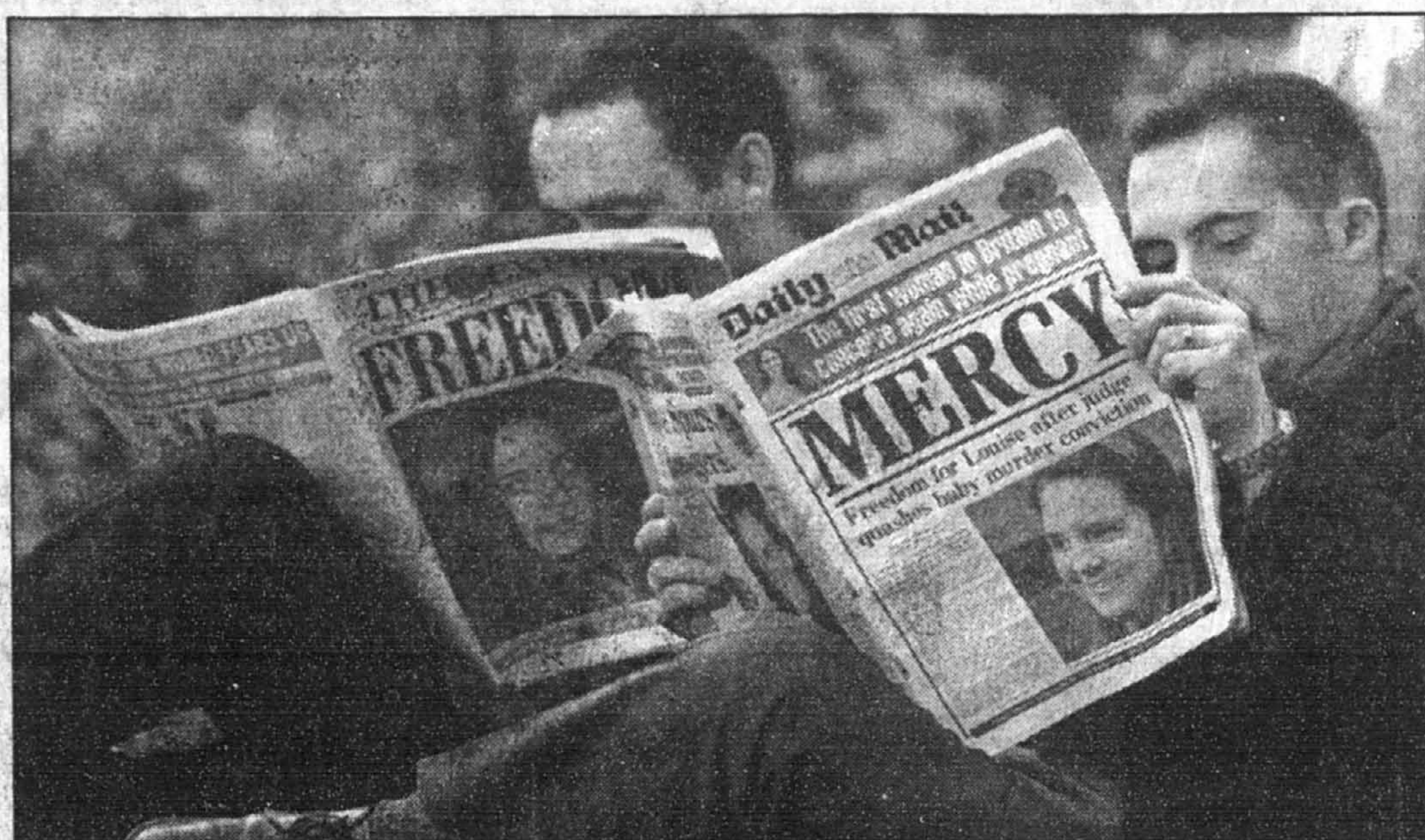
Les médias britanniques n'en avaient hier que pour la libération de Louise Woodward, comme le montrent les quotidiens que lisaient ces deux Londoniens hier midi.

ses déclarations répétées d'innocence et 37 % à penser que le juge a bien fait de la libérer.