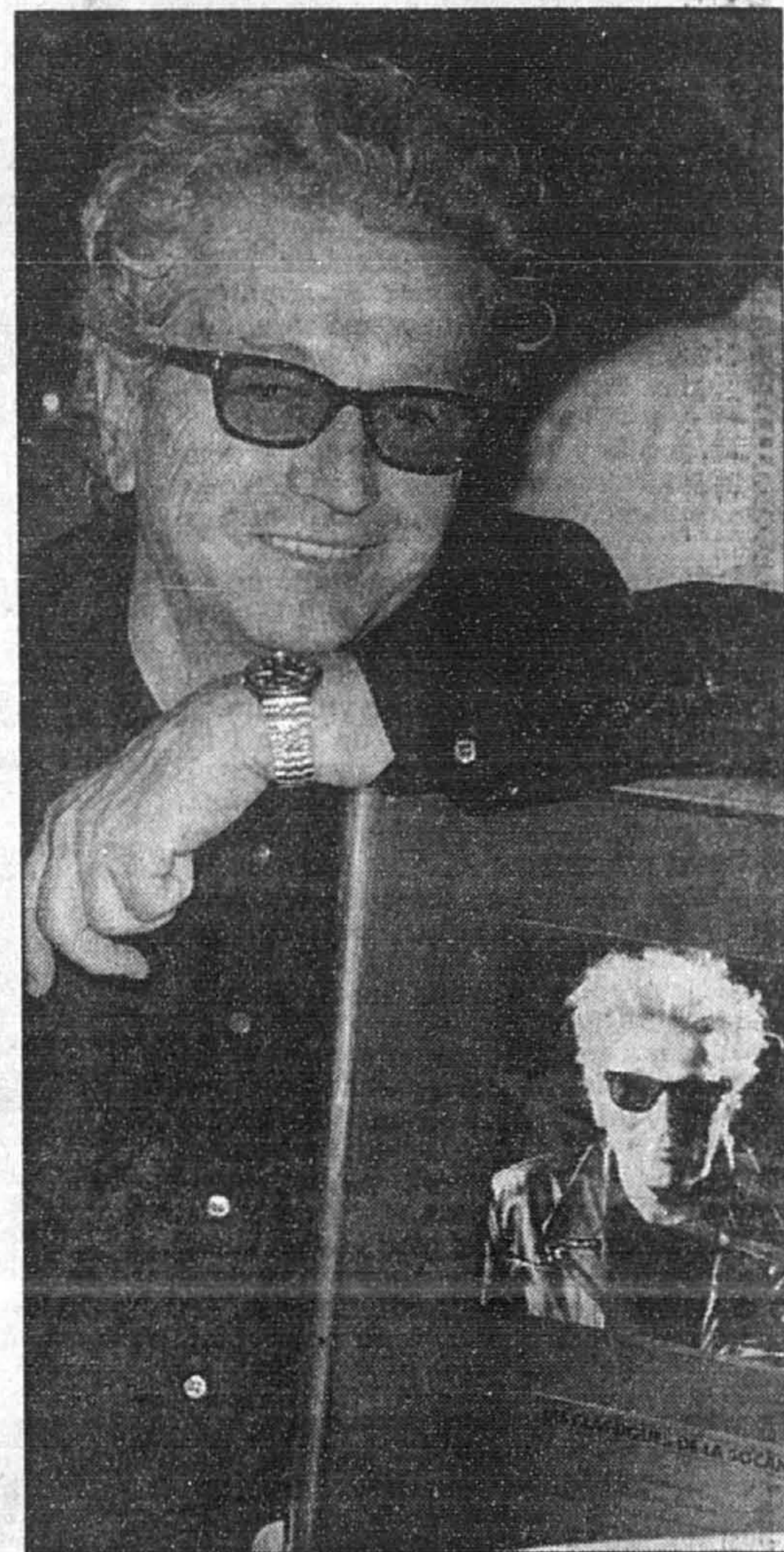
Luc Plamondon au huitième gala de la SOCAN qui réunissait les plus célèbres de nos auteurs : « Il faut encore recommencer à zéro. Les radiodiffuseurs veulent ramener le quota de chansons francophones à la radio autour de 50 %... »