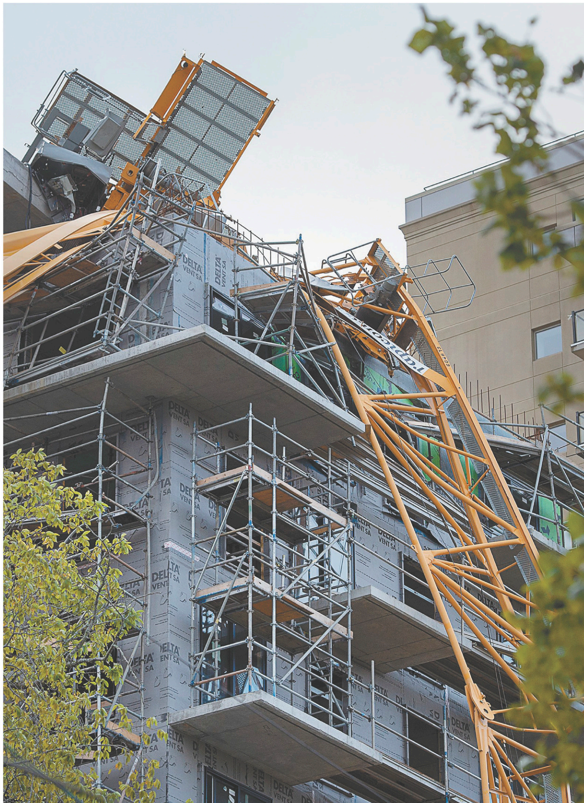
Une grue s'est affaissée sur un chantier de construction à Halifax dimanche. On ne rapporte aucun blessés.