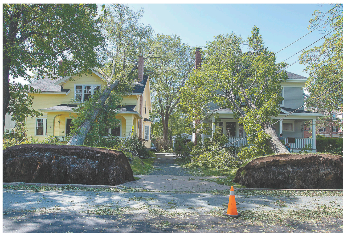
À Halifax, des arbres déracinés se sont écrasés sur des maisons, sans faire de blessés graves.