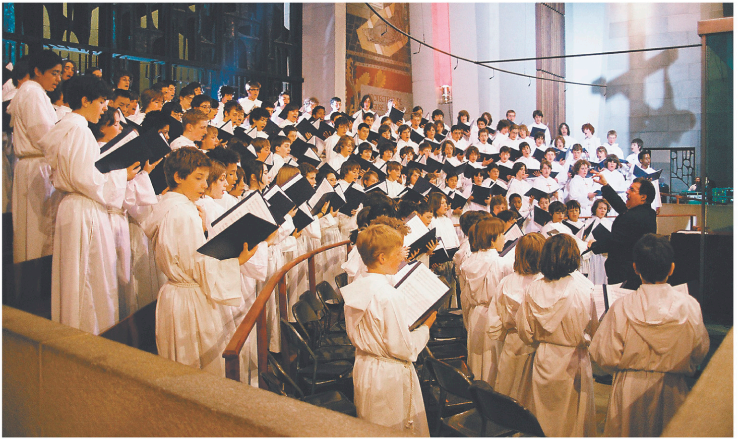
La Commission scolaire de Montréal avait mis fin à l'entente permettant à des garçons de fréquenter une école privée gratuitement.

Pierre Vadeboncoeur avait rédigé le texte principal de cette cérémonie funèbre. Hommage d'un écrivain à un autre, ce texte fut lu par le comédien Luc Picard. Des milliers de pages de Falardeau, rédigées à propos de questions sociales, culturelles et politiques, Vadeboncoeur avait retenu une phrase lapidaire et brillante qui, mise en exergue de sa vie, me semble toujours bien la résumer : « On va toujours trop loin pour ceux qui ne vont nulle part. »