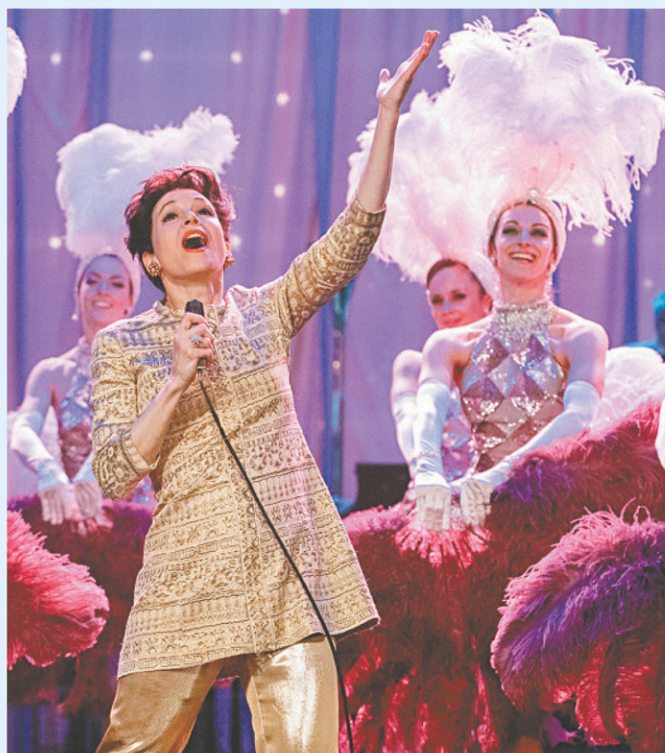
Renée Zellweger interprète Judy Garland dans le film Judy.