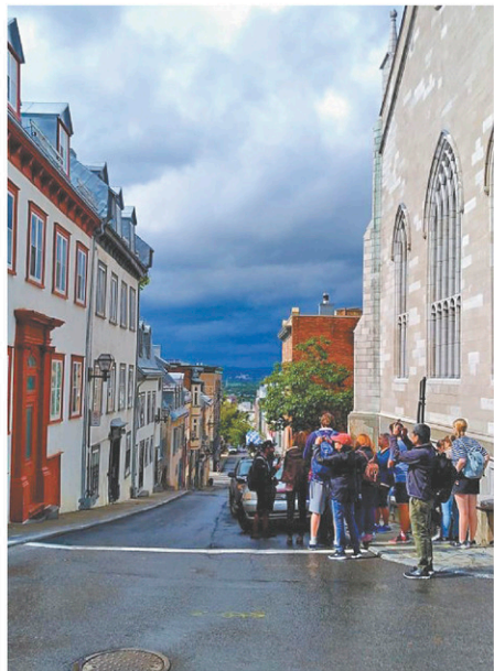
Des touristes longent la rue Dauphine et s'arrêtent au point culminant de la percée visuelle Sainte-Angèle, à Québec.

Inconsciemment, nous circulons dans les pas des premiers marcheurs. Certaines rues du Vieux-Québec, sentiers d'asphalte et de béton durcis par la modernité, suivent les mêmes tracés : la rue Dauphine en est un exemple éloquent. C'est dans cette zone que culminent certaines des percées visuelles les plus intéressantes du Vieux-Québec.