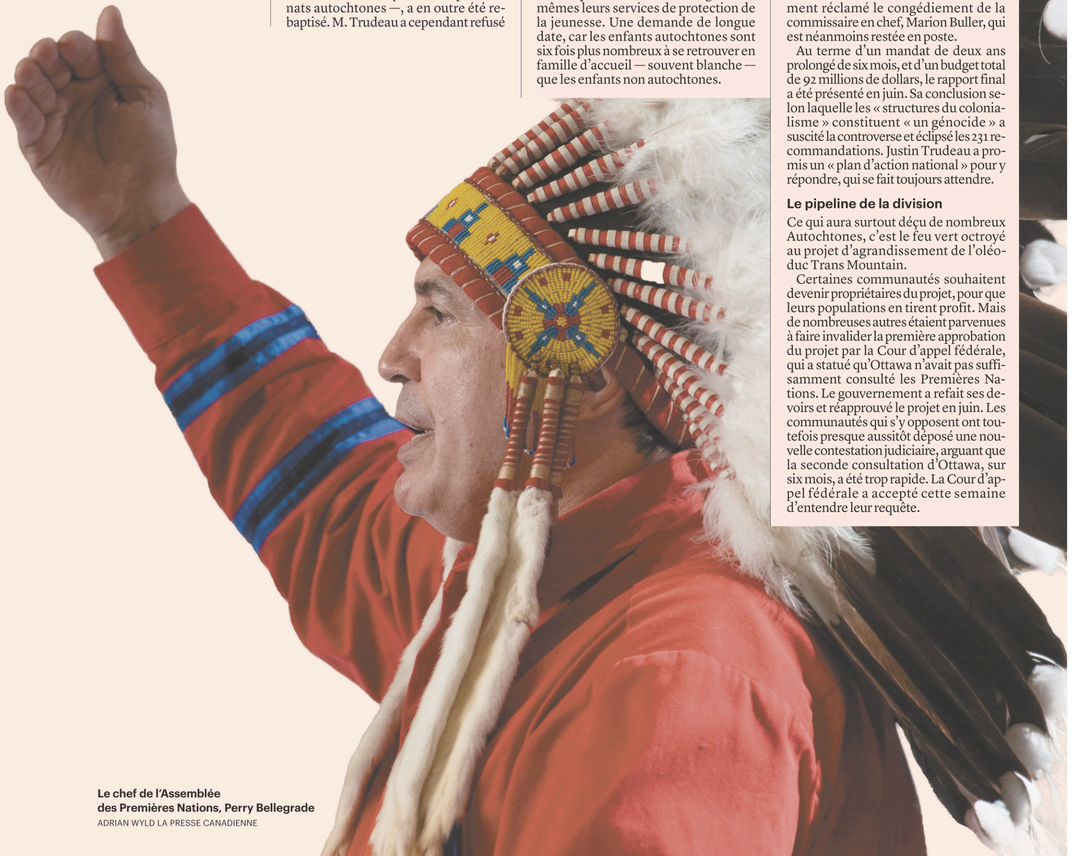
Le chef de l'Assemblée des Premières Nations, Perry Bellegrade

Certaines communautés souhaitent devenir propriétaires du projet, pour que leurs populations en tirent profit. Mais de nombreuses autres étaient parvenues à faire invalider la première approbation du projet par la Cour d'appel fédérale, qui a statué qu'Ottawa n'avait pas suffisamment consulté les Premières Nations. Le gouvernement a refait ses devoirs et réapprouvé le projet en juin. Les communautés qui s'y opposent ont toutefois presque aussitôt déposé une nouvelle contestation judiciaire, arguant que la seconde consultation d'Ottawa, sur six mois, a été trop rapide. La Cour d'appel fédérale a accepté cette semaine d'entendre leur requête.