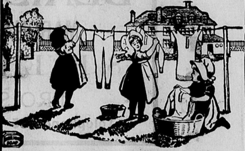
Les Fillettes Sunlight admirent les résultats produits par la méthode de laver suivant Sunlight.