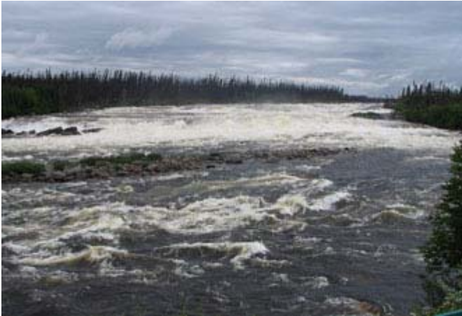
Rivière Rupert - Baie James - Québec

L'eau est une ressource naturelle essentielle à la vie et sa disponibilité est de plus en plus menacée. La surface de la planète est recouverte de 70% d'eau mais seulement 2,5% est constitué d'eau douce et moins de 0.3% est facilement accessible (lacs et rivières).