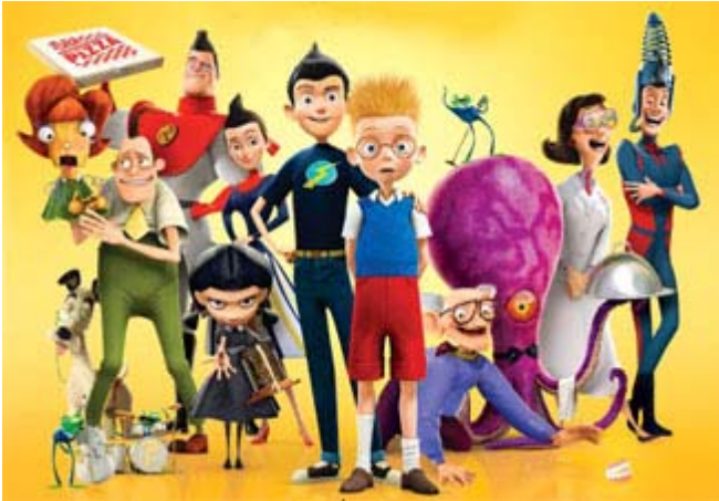
La famille Robinsons

Les studios Disney effectuent un retour en force au cinéma et la fusion complète de la compagnie PIXAR au sein de l'empire signifie la sortie de plusieurs films en format 3D qui seront signés Disney. La nouvelle création: «Meet The Robinsons» arrive actuellement en salle et cette production (traduit en français) vient confirmer les intentions de Disney d'occuper pleinement le créneau cinéma. Dans l'ensemble le dessin animé est bien fait et comme le mentionne la publicité: "Le film nous fait vivre l'expérience du futur comme seul peut l'imaginer Disney." À surveiller en juin, un autre film, "Ratatouille" , qui racontera l'histoire d'un chef et de son ami, un rat, dans un restaurant de Paris. Également une création en 3D. http://home.disney.go.com/index