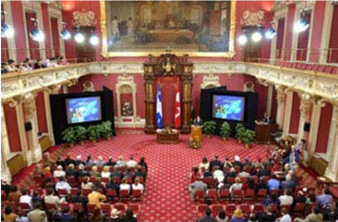
Salon rouge à l'Assemblée nationale

L'élection québécoise a donné lieu à une soirée aussi excitante qu'un match sportif où le résultat est serré. Le Québec a un nouveau leader! En fait, trois plutôt qu'un seul. Est-ce qu'un gouvernement composé de trois partis politiques possédant chacun environ le tiers des sièges (48, 41 et 36) peut survivre? Il faudra voir mais l'esprit de survie dépassera très certainement la noblesse des idées. Il est clair qu'aucun des trois chefs ne veut retourner en campagne électorale demain matin, surtout qu'un pareil exercice aura coûté 78 millions$ au Trésor public. Mais la principale raison est que l'on ne veut pas s'attaquer au nouvel héros du peuple: SUPER MARIO! (Voir éditorial de l'éditeur) www.LeStudio1.com/Editeur