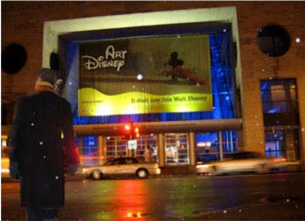
Musée des beaux-arts de Montréal