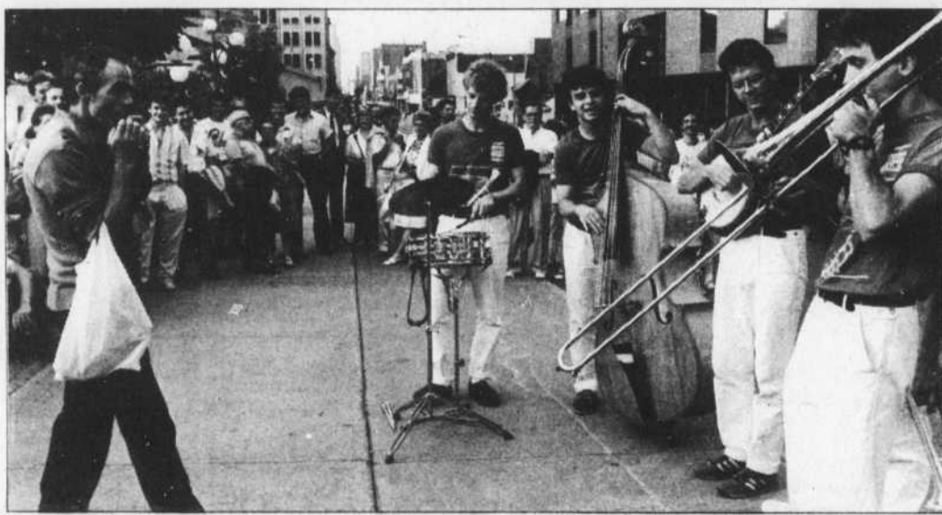
Emporté par les accords d'un orchestre ambulancier, un badaud ne peut résister à l'appel de son harmonica, qu'il avait sans doute placé dans sa poche... juste au cas.