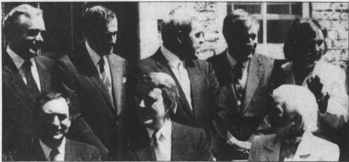
Le premier ministre Brian Mulroney a posé en compagnie du nouveau vice-premier ministre, M. Don Mazankowski, et de trois des ministres québécois à qui il a accordé des promotions dans le Cabinet qu'il a nommé lundi. Il s'agit de MM. Marcel Masse (Énergie, mines et ressources), Michel Côté (Expansion industrielle régionale), et Benoît Bouchard (Transports).

Pour ce faire, le premier ministre n'a pas lésiné sur les moyens: Il a renvoyé six ministres sur les banquettes arrières, fait entrer huit nouveaux ministres au cabinet, joué à la chaise musicale avec une