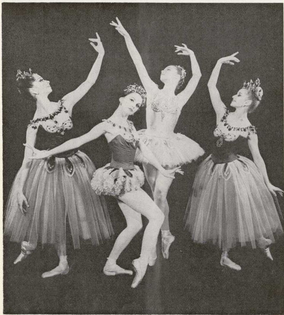
Mimi Paul, Patricia McBride, Suzanne Farrell, Violette Verdy