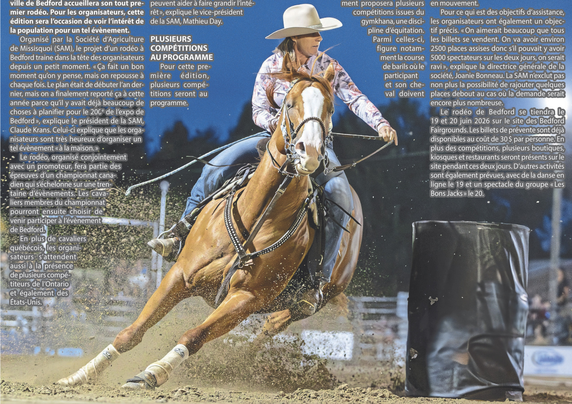
La Société d'Agriculture de Missisquoi organisera le rodéo de Bedford le 19 et 20 juin 2026.

Le rodéo de Bedford se tiendra le 19 et 20 juin 2026 sur le site des Bedford Fairgrounds. Les billets de prévente sont déjà disponibles au coût de 30 $ par personne. En plus des compétitions, plusieurs boutiques, kiosques et restaurants seront présents sur le site pendant ces deux jours. D'autres activités sont également prévues, avec de la danse en ligne le 19 et un spectacle du groupe «Les Bons Jacks» le 20.