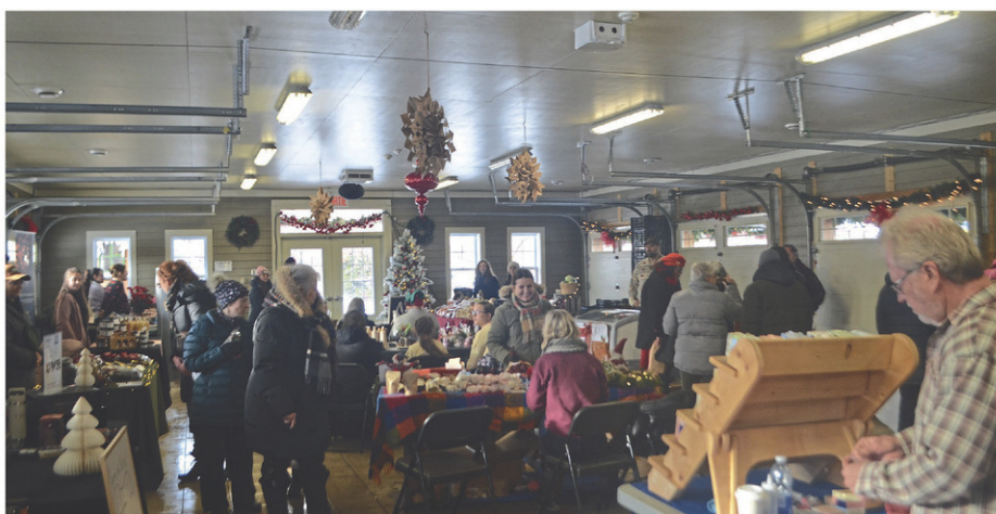
Cette année encore, le marché de Noël de Farnham a accueilli une foule conséquente.