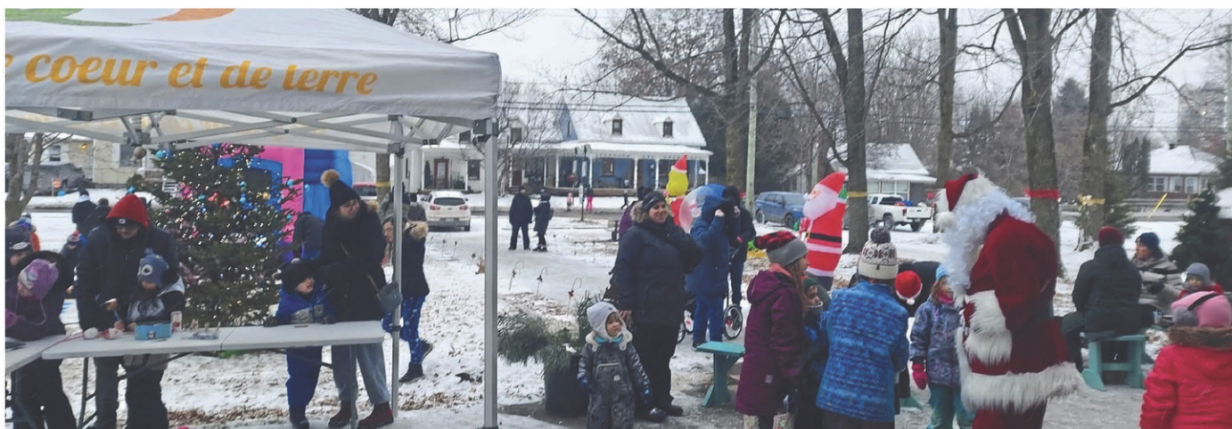
L'activité Magie de Noël s'est tenu le 7 décembre dernier devant l'église de Sainte-Brigide-d'Iberville.

Les visiteurs de la fête ont également eu la chance de faire un tour de calèche et recevoir des boissons chaudes et autres collations. Ceux qui le souhaitaient ont aussi pu faire parvenir