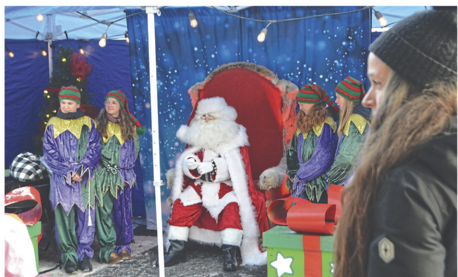
Arrivés sur place à 14 h, le père Noël et ses lutins ont rencontré les familles présentes et pris en note les souhaits des enfants.