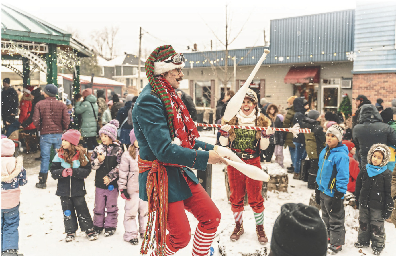
Plus de 1000 personnes ont assisté à la fête Noël Magique au centre-ville de Bedford le 6 décembre dernier.

À la fin de la journée, les visiteurs ont pu assister à un spectacle de feux d'artifice présentés par la ville.