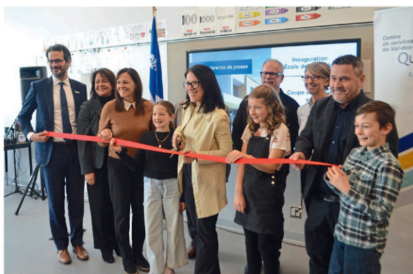
C'est la ministre Sonia Lebel qui a coupé le ruban d'inauguration de l'école.

L'école des Lucioles, réalisée à un coût global de 27 M$, accueille 343 élèves de la maternelle à la sixième année. Celle-ci comprend notamment 16 classes avec salle de bain, plusieurs locaux collaboratifs et de rencontre, un gymnase, une salle à manger et une cuisine commune. Pour ce qui est de la cour extérieure, celle-ci propose aux jeunes plusieurs modules de jeux, des zones multitextures en plus d'espaces pour des classes extérieures. Finalement, l'établissement scolaire répond aussi aux normes ministérielles en matière d'efficacité énergétique et de développement durable.