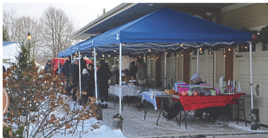
En plus des kiosques à l'intérieur du marché public, certains artisans étaient installés à l'extérieur.