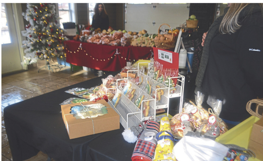
À l'intérieur, les visiteurs pouvaient se procurer plusieurs produits, notamment alimentaires. Au premier plan, il est possible de voir des biscuits confectionnés à la main et derrière, une multitude de légumes locaux.