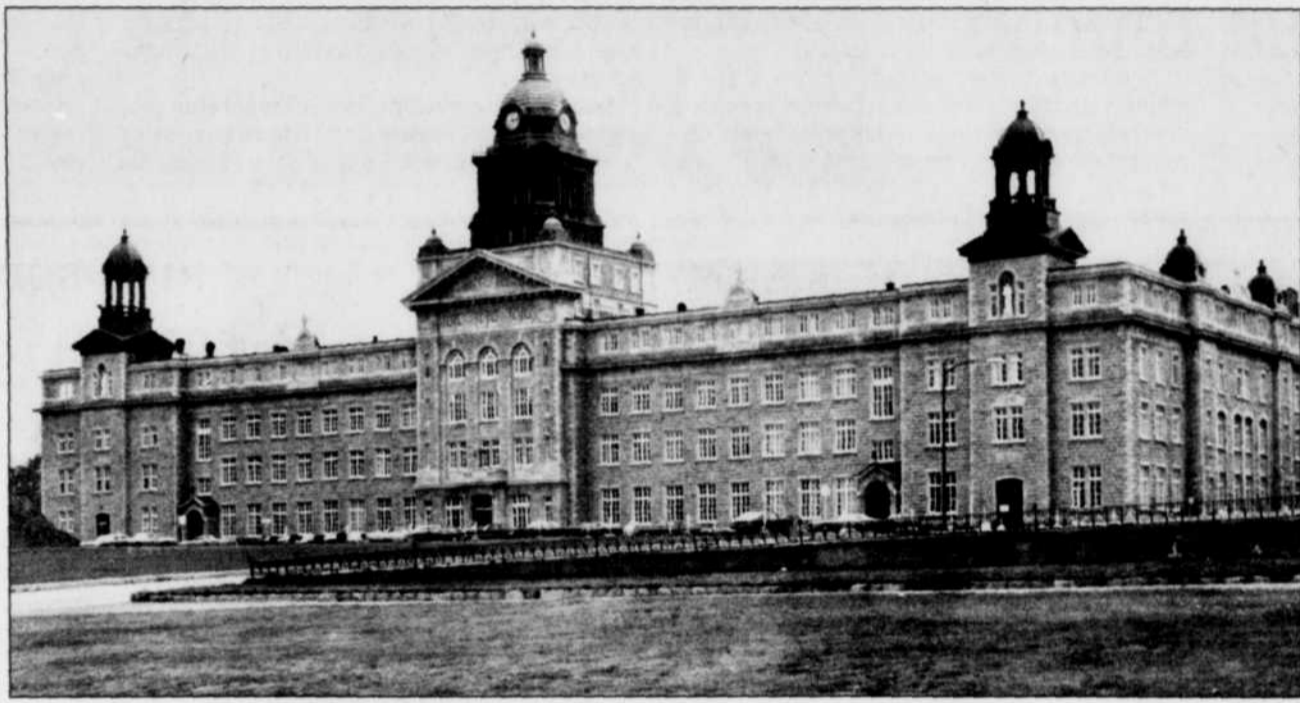
EST DU QUÉBEC

Il est possible de visiter l'exposition de la collection « La couleur de la Gaspésie » de la Fondation Claude-Picher, les jeudis et vendredis de 14h à 17h30, ainsi que les samedis de 14h à 17h, à la salle municipale de l'hôtel de ville de Matane. Ce nouvel horaire est en vigueur jusqu'au 22 décembre. Le prix d'entrée demeure le même, soit 1$ pour les adultes et 0,60 $ pour les groupes de huit personnes et plus. C'est gratuit pour les moins de 18 ans. R.P.