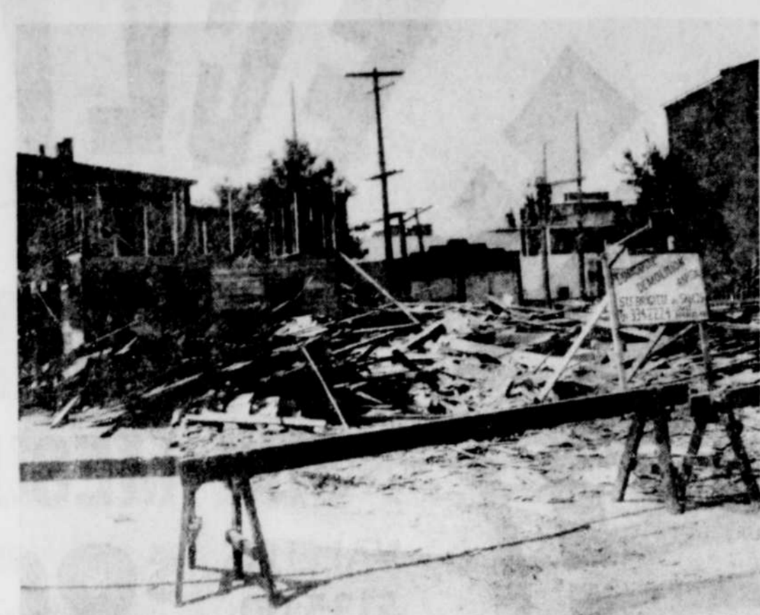
PLACE AU PROGRES — L'édifice en démolition que l'on voit ici fera place à un terrain de stationnement à l'angle des rues Brock et St-Jean, en fonction avec le programme de rénovation urbaine, tel que recommandé dans l'étude des urbanistes Larouche et Richard. Il s'agissait de quelques logements déués situés à l'arrière du restaurant Taft, et l'emplacement pourra accommoder plus de 50 automobiles. C'est pourquoi la cité s'en est portée acquéreur récemment.

DRUMMONDVILLE (J.P.C.) — Nous avons vu dans une édition précédente, la liste des contrôles municipaux, étudiée par les urbanistes Richard et Larouche, et rendue publique il y a déjà quelque temps. Nous avons parlé hier assez sommairement, du règlement de zonage et de construction que les urbanistes ont longuement étudié et ont suggéré dans leur rapport, la division en deux règlements distincts, ces deux items d'importance.