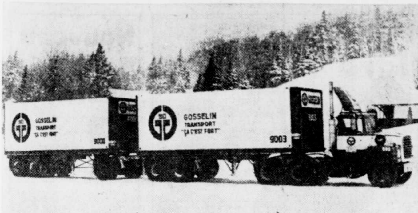
$450,000 sauvent Gosselin Transport de la faillite.

par Fortunat MARCOUX du bureau du Soleil