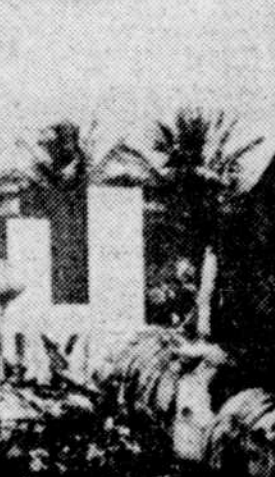
Certaines carcasses calcinées des avions de chasse américains détruits hier matin dans la base de Muniz, près de l'aéroport de San Jose de Porto Rico, par une série d'explosions de bombes à retardement.

CFR (Canal 11) Rimouski MARDI 13 JANVIER 18h00 Aujourd'hui le 13 janvier 18h30 La conquête de l'Ouest 19h30 Le clan Beaulieu 20h00 Toute la ville en parle 20h30 Hawaii 5-0 21h30 Michel Jasmin 22h29 La Quotidienne 22h30 Les nouvelles TVA 22h53 Dernière édition 23h00 Les sports 23h15 La couleur du temps 23h25 Ciné-Détente: "Si jeunesse savait".