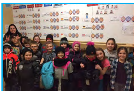
À l'école Notre-Dame-des-Anges, le groupe 230 a créé un tableau pour que tous les élèves puissent suivre les performances canadiennes.